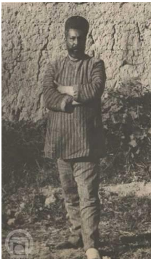
ارشادالدوله در بند، دقایقی پیش از اعدام

روز سیزدهم شهریور سال ۴۶۹ هجری خورشیدی (۶ رجب ۴۸۳ق) رئیس مظفر حاکم دامغان شد. حدود هشتصد سال بعد، جنبش تنباکو با کوتاه آمدن ناصرالدین شاه به پیروزی رسید و تلگراف شاه که الغای امتیاز تنباکو را اعلام می‌کرد در چنین روزی به سال ۱۲۷۰ به شهرهای مختلف رسید و شورشها را آرام ساخت. پانزده سال بعد در ۱۲۸۵ نظامنامه انتخابات مجلس شورای ملی که توسط هیئت پنج نفری تهیه شده بود از طرف مظفرالدین شاه توشیح شد، و یک سال بعد در ۱۲۸۶ پس از به قدرت رسیدن محمدعلی شاه اولین شماره‌ی روزنامه تندرو هتاک «روح القدس» به مدیریت سلطان العلمای خراسانی در تهران منتشر شد.