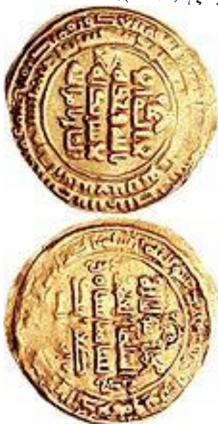
سکه‌ی دینار زر طغرل سلجوقی