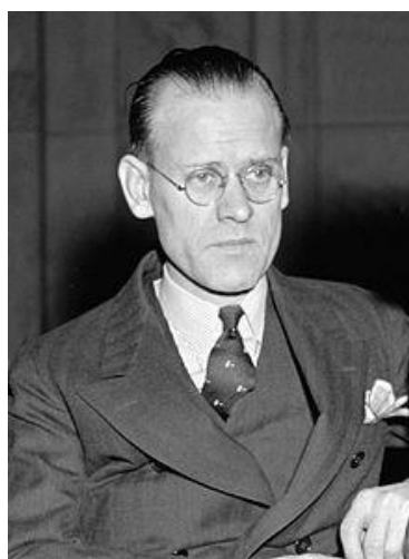
راست: فیلو فارنزورث