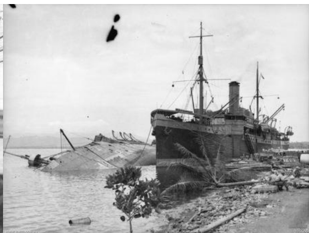
نبرد خلیج میلن