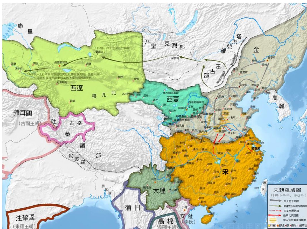
موقعیت دولت قراختائی (سبز روشن) نسبت به دولتهای چین و ایران شرقی

روز هجدهم شهریور سال ۵۲۰ هجری خورشیدی یلوداشی بنیانگذار دولت قراختائی به قلمرو قراخانیان حمله کرد. محمود قراخان که تابع دولت سلجوقی بود از سلطان احمد سنجر یاری خواست و او با سپاهی که سپهسالارش گرشاسپ بن علی بن فرامرز (آخرین امیر کاکویی یزد و ابرقو) بود، به یاری اش شتافت و ارتش بزرگ صد هزار نفره‌ای را بسیج کرد. قراختائیان که مغولستان امروز را در دست داشتند و حمله‌شان را می‌توان پیش درآمدی بر حمله‌ی مغول دانست، با ارتشی بسیار بزرگ که شمارش را با اغراق هفتصد هزار تن نوشته‌اند، در نبرد قطوان (واقع در شمال سمرقند) بر سلجوقیان چیره شدند و نزدیک به پنجاه هزار تن را کشتار کردند.