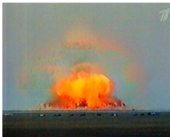
بالا: انفجار بمب روسی «پدر بمبها»

روبرو: منظره‌ی ماهواره‌ای از برجهای دوقلو پس از فروپاشی