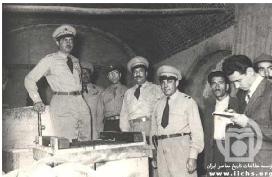
کشف انبار اسلحه‌ی سازمان افسران حزب توده

روز سیزدهم مهر سال ۱۳۲۷ زلزله‌ی شدیدی در اشک‌آباد (عشق‌آباد) به یک فاجعه‌ی تمام عیار تبدیل شد. این زلزله که برخی از اسناد نشان می‌دهد پیامد آزمایش بمبی اتمی در نزدیکی شهر توسط بلشویکها بوده، ۷/۳ ریشتر بزرگی داشت و به انهدام کامل شهر منتهی نشد، اما چنین می‌نماید که دولت شوروی از آن برای نابود کردن جمعیت فارسی‌زبان و پایبند به هویت شهر بهره جسته باشد. ارتش سرخ پس از این واقعه شهر را محاصره کرد و مسیرهای کمک‌رسانی خارجی به آنجا (به ویژه از طرف مشهد) را مهار کرد. درباره‌ی این واقعه سکوت و پنهانکاری بسیاری وجود دارد اما شواهد نشان می‌دهد که صد و ده هزار تن یعنی تقریباً کل جمعیت شهر در این جریان از میان رفته باشند. کمونیستها به جای مردم بومی این شهر قبایل ترکمنی که وادار به اسکان شده بودند را جای دادند و به این ترتیب اشک‌آباد امروزی شکل گرفت که مردمش زبان پارسی نمی‌دانند.