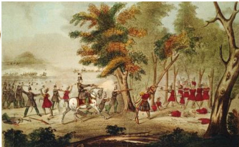
بالا: نبرد تیمز، بالا چپ: سکه‌ی هراکلیوس، روبرو: آلفونسوی هفتم لئون و کاستیل

در سیزدهم مهر ماه سال ۶۱۰ میلادی هراکلیوس در قسطنطنیه تاجگذاری کرد، در ۵۲۲ هجری خورشیدی آلفونسوی هفتم شاه لئون و کاستیل استقلال پرتغال را به رسمیت شمرد، و در ۱۱۹۲ در جریان نبرد تیمز در کانادا ارتش آمریکا سرخپوستان شاونی را شکست داد و رهبرانشان تکومش را به قتل رساند. در ۱۲۸۹ با پیروزی انقلاب در پرتغال نظام پادشاهی سرنگون شد و دولت جمهوری جایش را گرفت. در ۱۲۹۳ با آغاز نخستین نشانه‌های جنگ جهانی اول وینستون چرچیل به آنتورپ سفر کرد و بر خلاف نظر مشاورانش در ارتش انگلستان دو هفته سرسختانه در برابر آلمانی‌ها مقاومت کرد، ولی در نهایت با دادن ۲۵۰۰ تلفات ناچار به قبول شکست شد. درست در همین روز اولین نبرد هوایی با هدف کشتن حریف در جریان جنگ جهانی اول انجام شد. یک سال بعد (۱۲۹۴) هم بلغارستان به عنوان متحد قوای محور وارد جنگ جهانی اول شد. حدود سی سال بعد جنگ جهانی دوم در تداوم همین نبردها درگرفته بود و در چنین روزی به سال ۱۳۲۲ ژاپنی‌ها نود و هشت اسیر جنگی آمریکایی را در ویک‌آیلند کشتند.