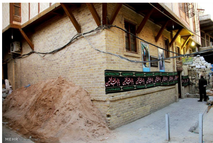
بالا: آیت‌الله خمینی و مصطفی خمینی در نجف