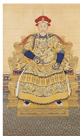
راست: یونگ ژنگ