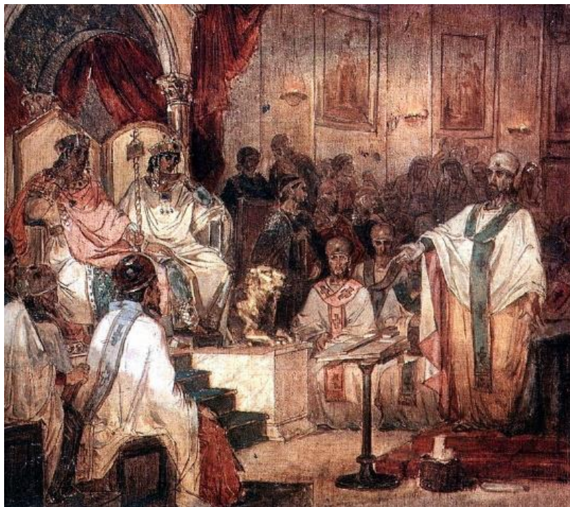
شورای اول کلسدون

۱۳۸۴ هم زلزله‌ی ۷/۶ ریشتری کشمیر به مرگ ۸۷ هزار و زخمی شدن بیش از هفتاد هزار تن انجامید و ۲/۸ میلیون نفر را بی‌خانمان کرد.