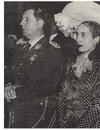
والتر فون رایشناو