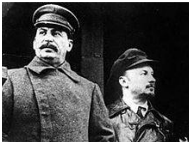
نیکولای بوخارین در کنار استالین