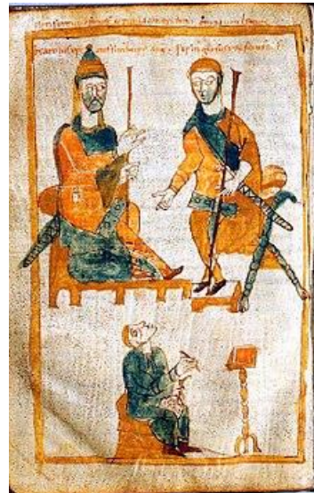
شارلمانی و کارلومان

هفدهم مهر در تاریخ سیاسی جهان بسیار پر حادثه بوده است. در ۱۴۷ هجری خورشیدی شارلمانی همراه با کارلومان اول به پادشاهی فرانکها برگزیده شد، در ۶۴۳ پادشاهی کاستیل شهر جرز که از پانصد سال پیش در دست مسلمانان بود را فتح کرد، در ۸۹۳ لویی دوازدهم شاه فرانسه با ماری تودور ازدواج کرد و در ۹۷۳ غارتگران پرتغالی در فرجان نبرد دانتور بر پادشاهی گندی در سریلانکا پیروز شدند و این دولت را از میان بردند.