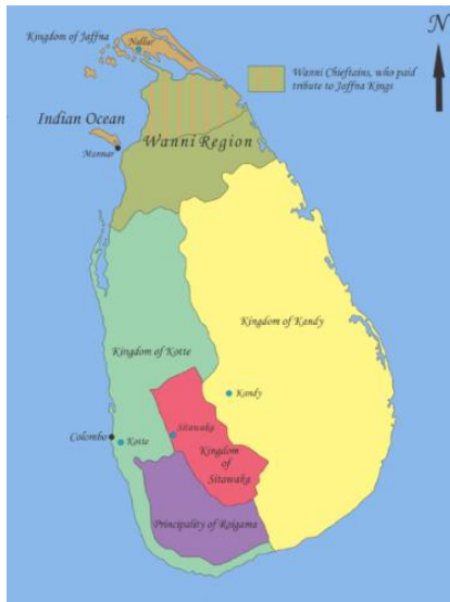
قلمروهای سیاسی سریلانکای قدیم

برعکس شهرتی جهانی را برای ملاله به ارمغان آوردند (تصویر روبرو).