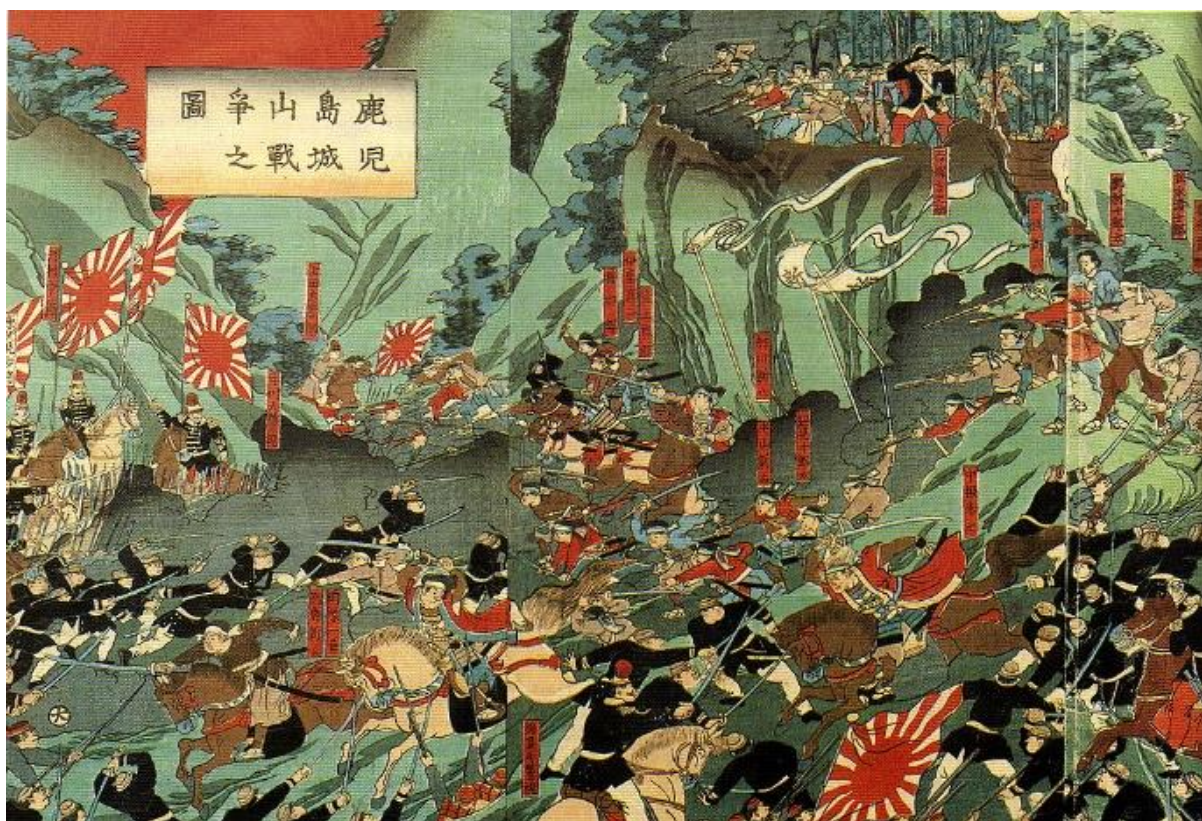
بازنمایی نبرد شیرویاما در نگارگری ژاپنی، سامورایی‌های سیاهپوش و شمشیرزدن در برابر سربازان تفنگدار

دوم مهرماه در تاریخ سیاسی جهان هم روزی مهم بوده است. در ۱۰۴۳ انگلیسی‌ها شهر نیوآمستردام را از هلندی‌ها گرفتند و بعدتر آنجا را نیویورک نامیدند، در ۱۲۳۲ در یاسالار دپوان به طور رسمی کالدونیای جدید را به اسم دولت فرانسه تصرف کرد، و در ۱۲۵۶ قوای امپراتور ژاپن با سی هزار سرباز در نبرد شیرویاما بر پانصد سامورایی شورشی هوادار خاندان ساتسوما غلبه کردند و آنها را تا نفر آخر کشتند. در ۱۳۵۲ گینه‌ی بیسائو از پرتغال مستقل شد، و در ۱۳۷۲ نورودوم سیهانوک شاه کامبوج به کشورش بازگشت و بار دیگر پس از دوران هولناک حاکمیت خمرهای سرخ قدرت را در دست گرفت، در حالی که کمونیست‌ها طی سه سال گذشته یک چهارم تا یک سوم جمعیت کشورش را قتل‌عام کرده بودند. در ۱۳۸۶ هم بین سی تا صد هزار تن در یانگون بر ضد دولت سرکوبگر برمه تظاهرات کردند.