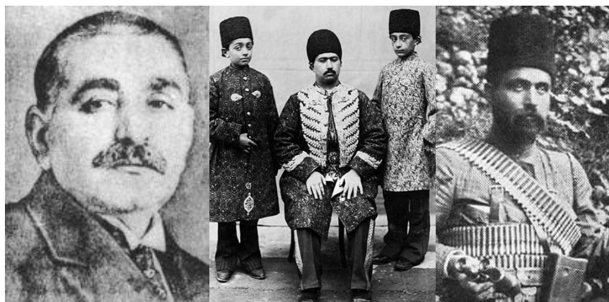
راست: پیرم خان، میان: سالارالدوله

در دوران معاصرمان این روز با رخداد‌های سیاسی متنوعی مصادف بوده است. در ۱۲۸۶ سلیمان میرزا اسکندری شعبه‌ی انجمن آدمیت را در کرمانشاه تاسیس کرد و مدرسه‌ی کرمانشاهان را نیز بنیان نهاد. درست یک سال بعد (در ۱۲۸۷) محمدعلی شاه که تازه بر ضد مجلس کودتا کرده بود، فرمانی خطاب به صدراعظم صادر کرد و متذکر شد که مجلس شورای ملی در ۲۲ آبان‌ماه افتتاح و شروع به کار خواهد کرد، ولی اهالی تبریز را از شرکت در انتخابات محروم نمود. تا سه سال بعد مشروطه‌خواهان او را از سلطنت عزل کرده بودند و مهمترین هوادارش که سالارالدوله بود در همین روز به سال ۱۲۹۰ خود را شاه خواند و کوشید به کمک عشایر غرب ایران بر مشروطه‌خواهان غلبه کند. در همین روز پیرم خان از سرداران بزرگ مشروطه‌خواه به دریافت یک قبضه شمشیر مرصع مخلع گردید و مجلس برای او مقرری سالیانه بر مبنای سه هزار و ششصد تومان تعیین نمود. او بلافاصله برای دفع خطر سالارالدوله به بسیج نیرو پرداخت. در همین روز انگلیسی‌ها هم از اغتشاش بهره جستند در بوشهر نیرو پیاده کردند.