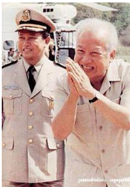
راست: نورودوم سیهانوک