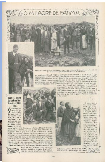
خبر معجزه‌ی آفتاب در روزنامه

این روز با چندین رخداد مذهبی نیز مقارن بوده است. در ۶۴۸ هجری خورشیدی کلیسای وست مینستر ساخته شد، در ۱۲۲۲ هنری جونز و یازده نفر دیگر سازمان بناء بئريت (فرزندان عهد) را در نیویورک تاسیس کردند که قدیمی‌ترین سازمان مدرن یاری‌رسانی به یهودیان است، و در ۱۲۶۰ خبرنگاری به نام الیعازر بن یهودا و دوستانش برای نخستین بار زبان عبری را برای گفتگو با هم به کار بردند. عبری تا پیش از آن زبانی مرده بود و تنها برای اجرای مراسم مذهبی کلیمیان کاربرد داشت.