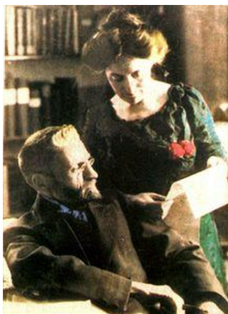
اليعازار بن يهودا

در این روز چند کشف و قرارداد علمی هم واقع شده که آن هم به آسمان و دنیای مینوی می‌مربوط می‌شود. در ۱۱۵۲ شارل مسیه اخترشناس فرانسوی کهکشان مارپیچی را کشف کرد، در ۱۲۶۳ کنفرانس جهانی نصف‌النهار تصمیم گرفت نصف‌النهار گرینویچ را مبدأ فرض کند، و این حدود دو و نیم هزاره پس از آن بود که ایرانیان در سیستان امروز محور نیمروز را با همین ترتیب تعیین کرده بودند که در شمال از آتشکده‌ی نوبهار بلخ عبور می‌کرد. این مبدأ تا بیش از دو هزاره در جهان قدیم رواج داشت و از این نظر هم کهتر و هم بادوامتر از محور صد و سی ساله‌ی گرینویچ است. در ۱۲۷۱ هم ادوارد امرسون بارنارد برای اولین بار به کمک عکسبرداری یک شهابسنگ (D/1892 T1) را کشف کرد. دو رخداد جالب دیگر این روز آن که در ۱۳۴۶ اولین عکس میکروسکپ الکترونی از ویروس ابولا گرفته شد، و در ۱۳۷۳ کنزابورو اوته نوبل ادبیات را برد