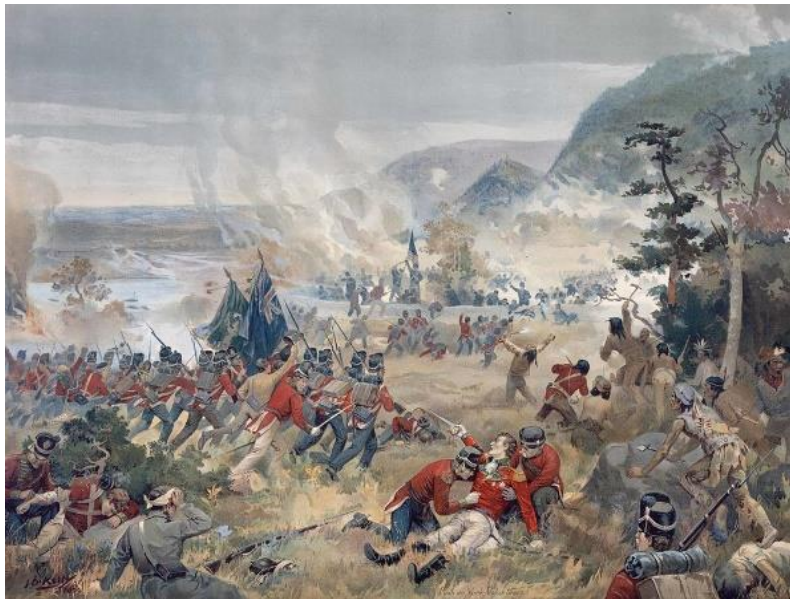
نبرد بلندیهای کوینستون

مهاجم آمریکایی را شکست دادند و عقب راندند. در ۱۳۰۰ هم مکزیک اعلام استقلال کرد و نظام سیاسی اش را امپراتوری دانست.