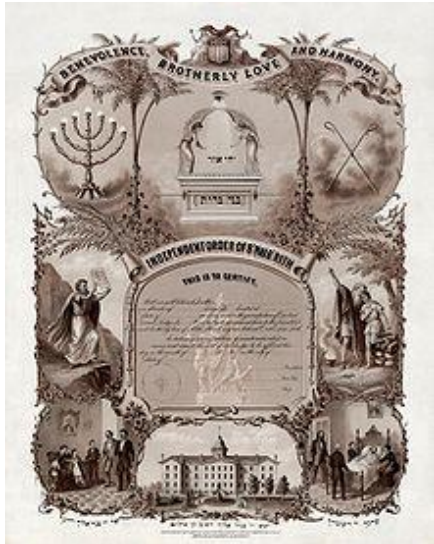
آگهی سازمان بناء بئريت