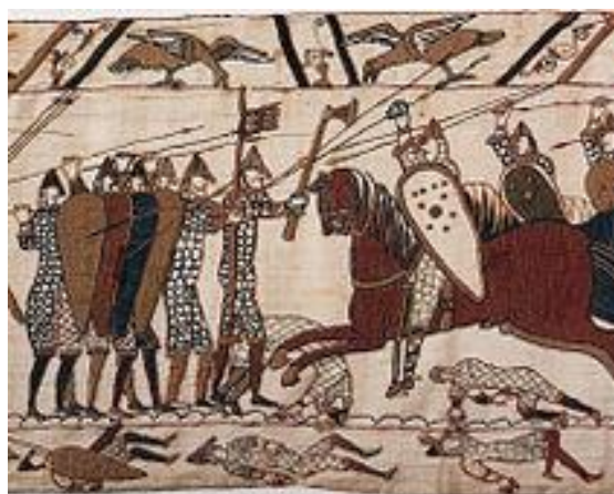
ویلیام فاتح در نبرد هستینگر