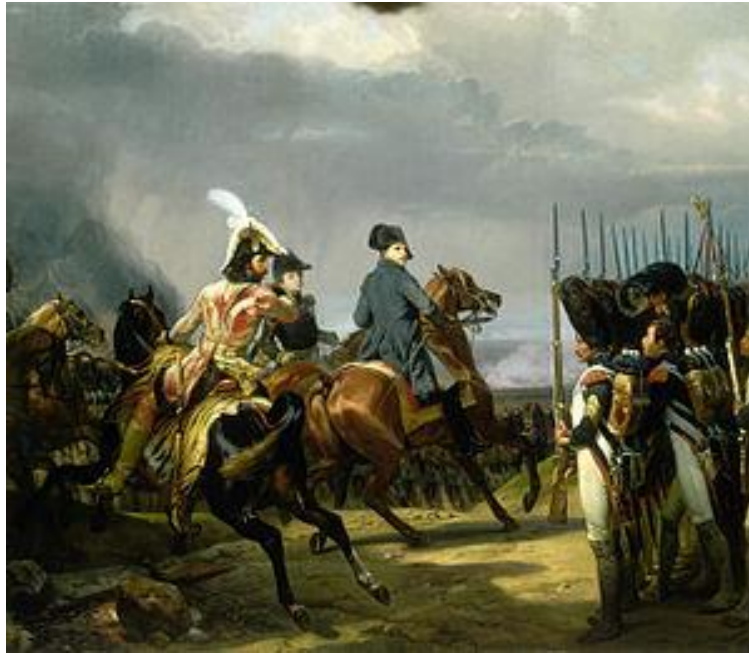
ناپلئون پیش از نبرد