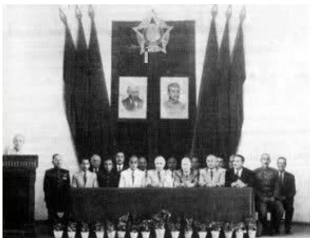
هیأت مؤسس حزب دموکرات آذربایجان زیر عکس استالین و لنین