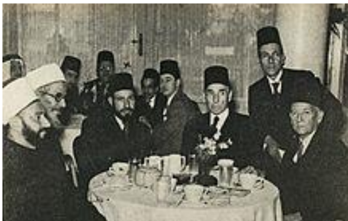
حسن البنا در میان یارانش