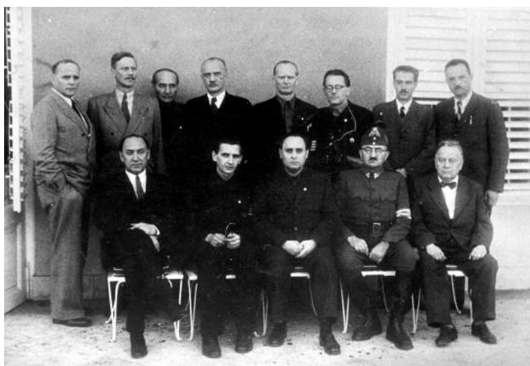
متفقین تیرباران شد

در ۱۳۱۹ لوییس کومپانیس رئیس جمهور کاتالونیا به فرمان فرانکو محاکمه و اعدام شد، و او تنها رئیس جمهوری اروپایی است که اعدام شده است. در ۱۳۲۳ حزب تیر و صلیب مجارستان که همسان و متحد با نازیها بود در این کشور به قدرت رسید و رهبران سیاسی دولت پیشین را مورد پیگرد قرار داد. در ۱۳۳۴ هم پیر لاوال نخست وزیر دولت ویشی که با آلمان نازی متحد شده بود، به جرم خیانت به دست