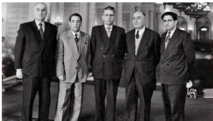
اعضای کمیته‌ی مرکزی حزب توده

در سال ۱۳۲۴ همدستی حزب توده با فرقه‌ی دموکرات پیشه‌وری که آشکارا دست‌نشانده‌ی شوروی بود و در صدد تجزیه‌ی آذربایجان، واکنشی در دولت برانگیخت. در این روز از طرف حکومت نظامی از اجتماع افراد حزب توده به منظور تشکیل مینیتنگ و سخنرانی جلوگیری به عمل آمد و دفتر حزب توده و شورای متحده‌ی کارگران به وسیله‌ی فرستادگان دولت و ژاندارمری تصرف شد. عبور و مرور از خیابان فردوسی که دفتر حزب توده در آن قرار داشت هم محدود شد. با این همه اعضای حزب توده در این مکان حضور یافتند و به زد و خورد با افراد ژاندارمری و ارتشی‌ها پرداختند. در این هنگامه سرگرد زرین‌نعل از افسران ملی‌گرا به شدت دکتر فریدون کشاورز که از سران حزب توده و نماینده‌ی مجلس بود را کتک زد! با این همه جریان این حزب تداوم یافت، تا آن که در سال ۱۳۳۳ رخنه‌شان در ارتش و نیروهای مسلح برملا شد و در همین روز در این سال دادگاه بدوی فوق العاده نظامی حکم اعدام دسته دوم افسران عضو این سازمان را صادر کرد. هفت سال بعد در ۱۳۴۰ سندیکای صنایع ایران تشکیل شد و نخست وزیر وقت آن را افتتاح کرد. سال بعد از آن وقتی محدود کردن قواعد دینی در انتخابات انجمنهای ایالتی و ولایتی به اعتراض برخی از رهبران دینی منتهی شد، شاه نامه‌ای به آیات عظام فرستاد و ضمن ابراز ادب دلگرم‌شان کرد که خودش مراقب خدشه‌دار نشدن دین هست، اما در ضمن به تلویح گفت که از اجرای این قانون دست نمی‌کشد. او به عمد در میان رهبران معترض نام آیت‌الله خمینی را از قلم انداخت و برای او نامه‌ای نفرستاد.