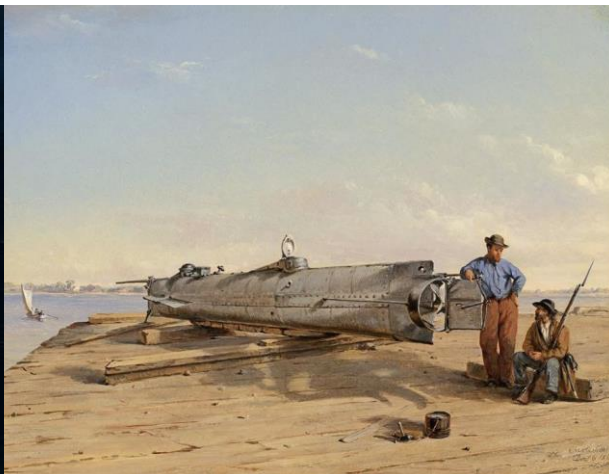
هوراس هانلی در کنار زیردریایی‌اش

الگوی جالب توجه دیگری که در رخدادهای بیست و سوم مهر می‌بینیم آن است که این روز با چندین رخداد مربوط به سفر در محیطهای غیرعادی مصادف بوده است و روزی مهم در صنعت ساخت هواپیما و سفینه و زیردریایی است! در ۱۱۶۲ اولین پرواز انسانی با بالن برادران مونگولفیه انجام شد، در ۱۲۴۲ اولین زیردریایی‌ای که کشتی‌ای را (در جریان جنگهای داخلی آمریکا) غرق کرده بود، در جریان حادثه‌ای غرق شد و جان مخترعش هوراس ال. هانلی را گرفت، در ۱۳۰۷ اولین بالون زیپلین که از اقیانوس اطلس عبور کرد ساخته شد، و در ۱۳۱۱ اولین پرواز شرکت هواپیمایی تاتا (که امروز به هواپیمایی هند تبدیل شده) انجام شد. در ۱۳۷۶ هم کاوشگر کاسینی به سوی کیوان پرتاب شد. در ۱۳۸۰ سفینه‌ی گالیله که توسط ناسا پرتاب شده بود از ۱۷۰ کیلومتری آیو ماه برجیس عبور کرد، و در ۱۳۸۲ چین نخستین سفینه‌ی سرنشین‌دارش به نام شن‌زونگ ۵ را به فضا فرستاد.