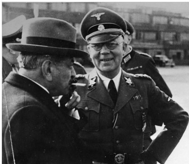
پیر لاوال و کارل اولبرگ فرمانده پلیس آلمان در قلمرو فرانسه

جاسوسی دستگیر شد، در ۱۲۹۶ رقص هلندی ماتاهاری به جرم جاسوسی برای آلمانها توسط سربازان فرانسوی اعدام شد.