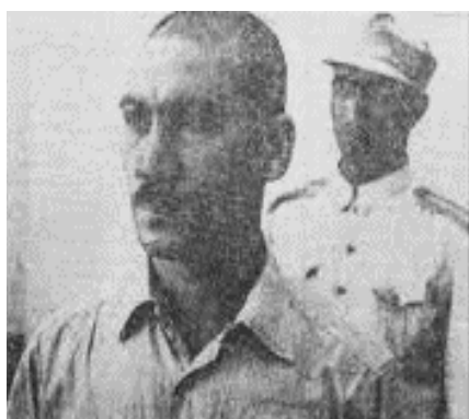
مرتضی کیوان در زندان

در چنین روزی به سال ۱۳۴۲ بارندگی شدید در مازندران سیلی جاری کرد که تلفات سنگینی به بار آورد. در ۱۳۶۶ نیروی دریایی آمریکا با شش رزمناو و سه هواپیمای جنگی در پشتیبانی از ناوگان عراق به سکوهای نفتی ایران در خلیج پارس حمله کرد و دو سکو را منهدم کرد، و در ۱۳۸۴ صدام حسین در بغداد به جرم جنایت علیه بشریت محاکمه شد.