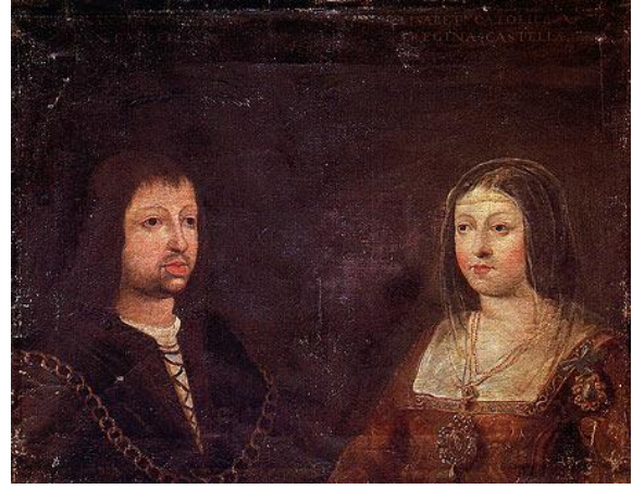
فردیناند آراگون و ایزابل کاستیل

در چنین روزی به سال ۲۰۲ پیش از میلاد رومیان با فرماندهی اسکپیو آفریکانوس در نبرد زاما بر کارتاژی‌هایی که زیر فرمان هانیبال می‌جنگیدند غلبه کردند. هریک از دو سو بین سی تا چهل هزار تن زیر فرمان داشتند که نیمی از کارتاژی‌ها و یک چهارم قوای رومی و نومی‌های متحدشان در جنگ کشته شدند. این جنگ دور دوم جنگ‌های پونیک را با پیروزی روم به پایان رساند و بین دو کشور صلحی برقرار شد. در ۴۳۹ میلادی وانداها با رهبری گایسریک کارتاژ را فتح کردند