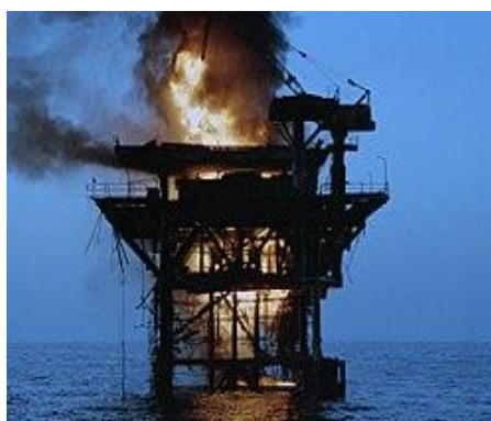
سکوی نفتی منهدم شده‌ی ایران