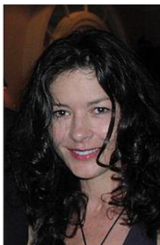
کاترین زتا جونز