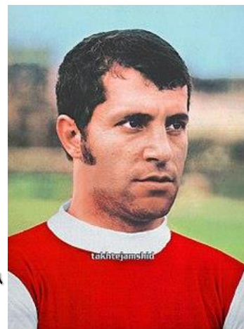
راست: علی پروین