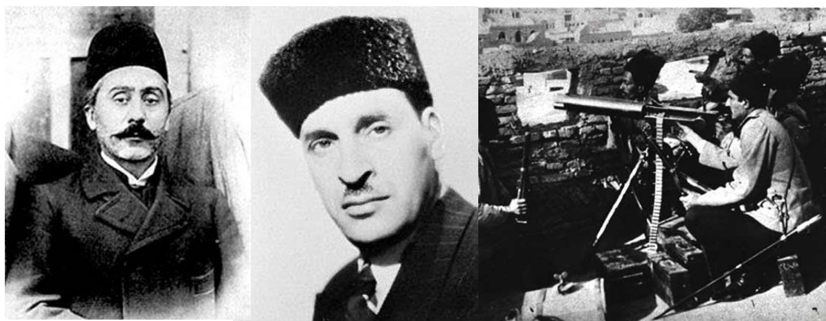
یوسف خان مستشارالدوله

در دوران معاصر در سوم مهر سال ۱۲۶۱ میرزا یوسف خان مستشارالدوله به خاطر آن که در روزنامه‌ی اختر به نفع مشروطه مطلب نوشته بود دستگیر شد و با غل و زنجیر در خانه‌ی حاجب‌الدوله بازداشت شد. با این همه چون جرمش در بدگویی از دولت اثبات نشد خشم ناصرالدین شاه به جایی نرسید و اندکی بعد آزادش کردند. شانزده سال بعد همین مشروطه‌خواهان چندان نیرومند شده بودند که وقتی محمدعلی شاه نوه‌ی ناصرالدین شاه بر ضد مجلس کودتا کرد، با قوای مسلحی به مقاومت پرداختند. روز جمعه سوم مهر سال ۱۲۸۷ یک سپاه دولتی با سی تا سی و پنج هزار سرباز به گروهی سیصد نفره از مجاهدان مشروطه‌خواه که در تبریز سنگر گرفته بودند حمله کردند و شکست خوردند و وادار به عقب‌نشینی شدند. در همین گیر و دار سربازی دلیر در سپاه دولتی حضور داشت که تا نُه سال بعد (۱۲۹۶) به ریاست باطالیون تیرانداز رسید، و او رضا خان سوادکوهی بود که چند سال بعد به تاج و تخت دست یافت.