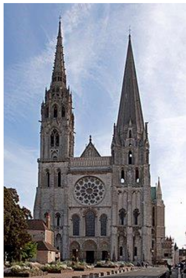
کلیسای جامع شارتر