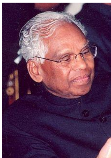
ک. ر. نارایان

در ضمن چند واقعه‌ی پراکنده اما جالب دیگر هم در این روز رخ داده است. مثلا دو شهر آمستردام (۶۵۴) و فیلادلفیا در منطقه‌ی پنسیلوانیا (۱۰۶۱) در چنین روزی تاسیس شده‌اند. در ۱۳۴۰ ناسا اولین موشک مدل ساتورن را آزمایش کرد، و در ۱۳۶۵ انگلستان به شکلی ناگهانی تنظیم دولتی بر بازار را حذف کرد. این ماجرا که بازسازی کل نظام اقتصادی کشور منتهی شد را بعدتر مهبانگ نامیدند!