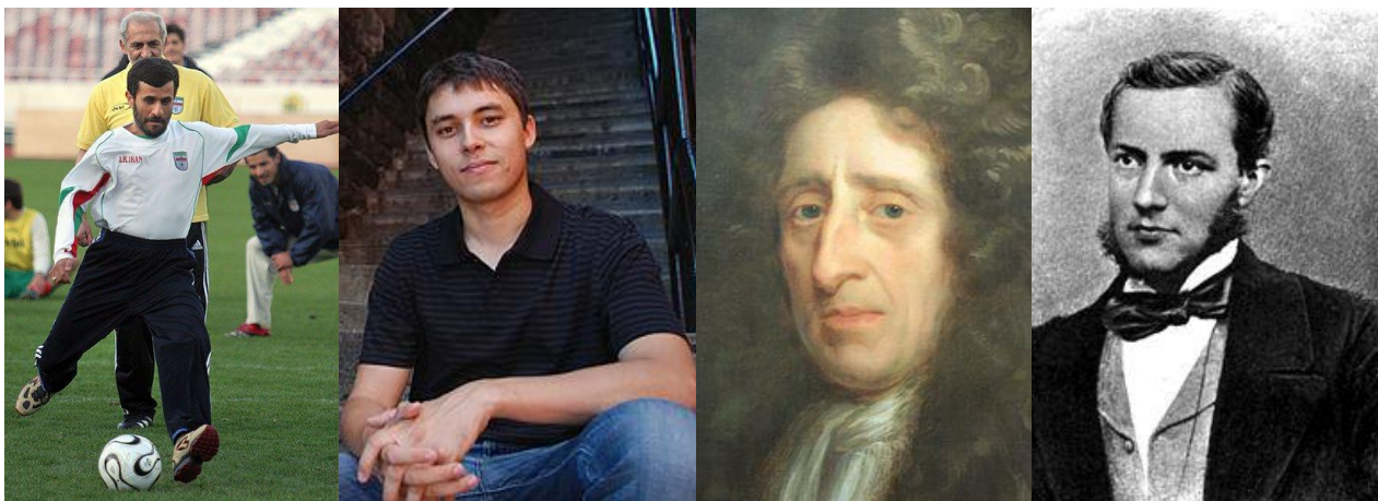
محمود احمدی نژاد