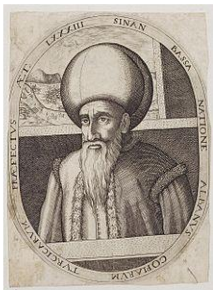
خواجه سنان پاشا

در ۷۹۹ هجری خورشیدی با تکمیل ساخت شهر ممنوعه پکن به عنوان پایتخت دودمان مینگ رسمیت یافت، در ۸۷۱ کریستف کلمب به کویبا رسید، و در ۹۱۰ قوای احمد بن ابراهیم غازی حاکم منطقه‌ی عدل در سومالی امروزی در نبرد آمباسل بر قوای داود دوم امپراتور حبشه غلبه کرد و بخشهای جنوبی حبشه را در اختیار گرفت.