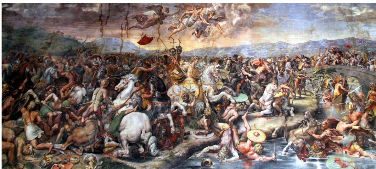
نبرد پل میلویان، اثر گیولیو رومانو (۱۵۲۴-۱۵۱۷ م.)

در سالهای اخیر این روز با دو رخداد در قفقاز مصادف بوده است. در ۱۳۶۹ اولین انتخابات چند حزبی در گرجستان برگزار شد و در ۱۳۷۴ در جریان آتش‌سوزی در متروی باکو که بزرگترین فاجعه از این نوع بود، ۲۸۹ نفر کشته و ۲۶۵ نفر زخمی شدند. در ۱۳۸۸ هم انفجار بمب در پیشاور به مرگ ۱۱۷ نفر و زخمی شدن ۲۱۳ تن انجامید.