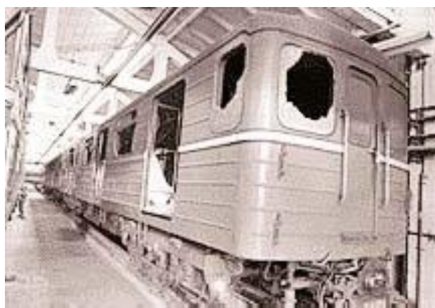
آتشسوزی در متروی باکو

در دهه‌های اخیر این روز با رخدادهای مربوط به کمونیسم و مارکسیسم هم پیوندی داشته است. در ۱۳۴۱ خروشچف دستور داد موشکهای شوروی از کوبا برچیده شوند و به این ترتیب بحران موشکی کوبا خاتمه یافت، در ۱۳۶۱ حزب سوسیالیست کارگران اسپانیا در انتخابات برنده شد و برای نخستین بار پس از دوران فرانکو جناح چپ در این کشور به قدرت رسید، و در ۱۳۸۶ مراسم تدفین و یادبودی برای