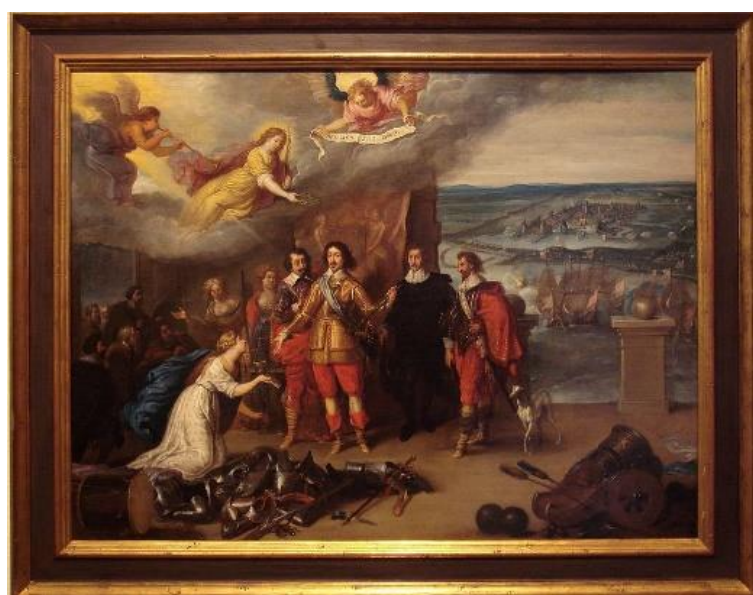
تسلیم لاروشل به لویی سیزدهم