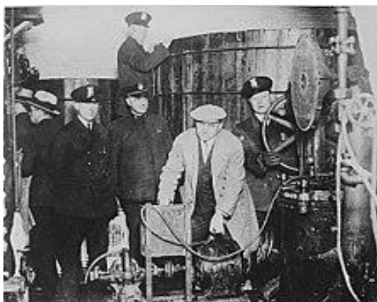
دستگیری شرابسازان غیرقانونی

در سال ۱۰۰۷ هجری خورشیدی در جریان جنگهای مذهبی فرانسه لویی سیزدهم و کاردینال ریشلیو موفق شدند پس از چهارده ماه محاصره هوگوهای پروتستانی که در شهر لاروشل حصارى شده بودند را به تسلیم وا دارند، در ۱۲۱۳ در جریان «کشتار پنجره» مهاجران انگلیسی بیش از پنجاه تن از بومیان غیرنظامی استرالیایی را کشتار کردند، در ۱۲۹۷ کشور چکسلواکی با اعلام استقلال از امپراتوری اتریش-هنگری تاسیس شد. در ۱۳۰۱ موسولینی به همراه سی هزار تن از پیروانش راهپیمایی مشهورش به رم را به فرجام رساند و با ورود به رم با فرمان پادشاه به صدارت رسید و فاشیستها قدرت را در دست گرفتند. هم او در سال ۱۳۱۹ به دنبال بی توجهی یونان به اولتیماتوم ایتالیا، از راه آلبانی به یونان حمله کرد و این کشور را به میدان جنگ جهانی دوم کشید.