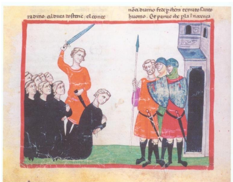
گردن زدن کنرادین شاه اورشلیم

به جمهوری تانزانیا تغییر داد. در ۱۳۵۹ هم هواپیمایی که برای شرکت در عملیات نجات گروگانهای آمریکایی در ایران تجهیز شده بود در پایگاه هوایی اگلین در فلوریدا سقوط کرد و باعث شد برنامه‌ی این عملیات لغو شود.