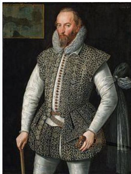
سر والتر رالی

این روز در اروپا با دسیسه‌ها و قتل‌هایی سیاسی نیز مقارن بوده است. در ۷۶۹ در جریان اولین محاکمه‌ی جادوگران در پاریس سه نفر به این جرم به اعدام محکوم شدند، در ۹۹۷ سر والتر رالی نویسنده‌ی ماجراجوی انگلیسی به امر جیمز اول شاه انگلستان گردن زده شد، و در ۱۳۲۱ انگلستان با تشکیل گردهمایی بزرگی از کشیشان و رهبران دینی نبردی تبلیغاتی را بر ضد نازی‌ها آغاز کرد و آلمانی‌ها را متهم کرد که درست یک سال پیش در گتوی کاوناس ده هزار یهودی را به ضرب گلوله کشتار کرده‌اند. سندی درباره‌ی چنین کشتاری یافت نشده و کشتار یهودیان یک سال پس از این ماجرا آغاز شد. در دوران معاصر هم به سال ۱۳۷۳ فرانسیسکو مارتین دوران به کاخ سفید حمله کرد و کوشید بیل کلینتون را به قتل برساند، و ده سال