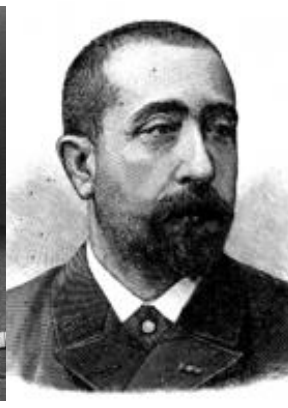
ژیل دو لاتوره