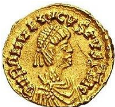
سکه‌ی رومولوس آگوستوس

سال بعد در ۱۳۷۷ صدام حسین اعلام کرد که دیگر با سازمان ملل درباره‌ی نظارت بر سلاح‌هایش همکاری نمی‌کند و این مقدمه‌ی حمله‌ی غربیان به عراق بود.