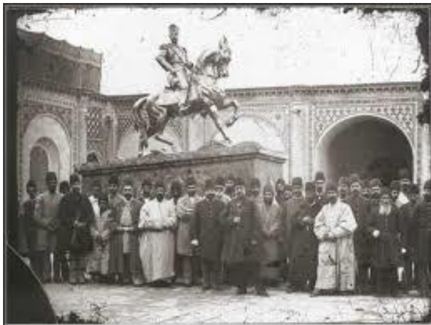
ناصرالدین شاه در کنار مجسمه‌ی خودش در باغشاه

در چنین روزی به سال ۶۲ هجری خورشیدی در جریان شورش عبدالله بن زبیر بر اموی‌ها، سپاهیان اموی به رهبری حسین بن نمیر به مکه حمله بردند و آن را محاصره کردند و در نبردی که درگرفت بنای کعبه را آتش زدند و با خاک یکسان کردند. حدود دوازده قرن بعد در روز سه شنبه نهم آبان سال ۱۲۶۷ (۲۴ صفر ۱۳۰۶ق) اتابک امین السلطان صدراعظم ناصرالدین شاه امتیاز کشتیرانی در رود کارون را به انگلیسی‌ها داد. درست یک سال بعد (۱۲۶۷) ناصرالدین شاه در راه برگشت از فرنگ بود که در یک فرسخی تبریز حالش به هم خورد و به بستر افتاد. عین‌الدوله که گمان می‌کرد شاه رو به موت است، خبر مرگش را برای پسر و ولیعهدش مظفرالدین میرزا برد. اما شاه بهبود یافت و با شنیدن این که عین‌الدوله و پسرش از خبر مرگش خوشحال شده‌اند خشمگین شد و دستور داد فرمانفرما و امیر نظام چند توسری به عین‌الدوله بزنند!