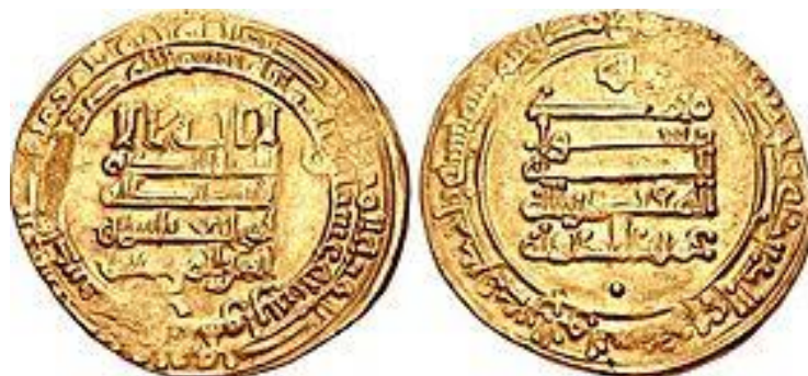
سکه‌ی مقتدر خلیفه‌ی عباسی

روز نهم آبان از نظر دگردیسی‌های سیاسی به نسبت خلوت و آرام بوده است. البته در سال ۴۷۵ میلادی رومولوس آگوستوس امپراتور روم غربی شد، در ۱۲۹۷ هجری خورشیدی امپراتوری اتریش-هنگری از میان رفت، و در ۱۳۳۵ انگلستان و فرانسه برای گشودن کانال سوئز به بمباران مصر روی آوردند. با این همه این روز با مرگ‌های نابهنگام و قتل‌هایی سیاسی پیوند خورده است. در چنین روزی به سال ۱۳۰۴ میخائیل فرونزه سردار ارتش سرخ و آدمکش بلشویک که کشتار مردم خیوه و بخارا و سرکوب مقاومت ایرانیان در سغد و خوارزم را به انجام رسانده بود، در حالی که ظاهراً نیازی به عمل جراحی نداشت با اصرار استالین و میکویان که رقیبان سیاسی‌اش بودند به دست جراحان سپرده شد و بر تخت عمل درگذشت!