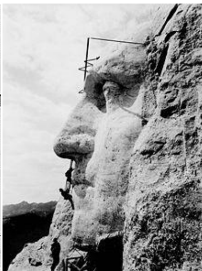
ساخت سردیسه‌های کوه راشمور