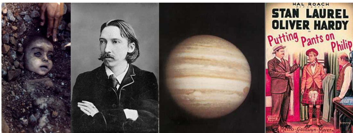
اولین فیلم لورل و هاردی اولین عکس از برجیس رابرت لویی استونسون قربانی فاجعه‌ی بوپال

نخستین بار عکسهایی دقیق و نزدیک از برجیس به زمین ارسال کرد و در ۱۳۷۳ اولین نمونه‌های PlayStation در ژاپن عرضه شد.