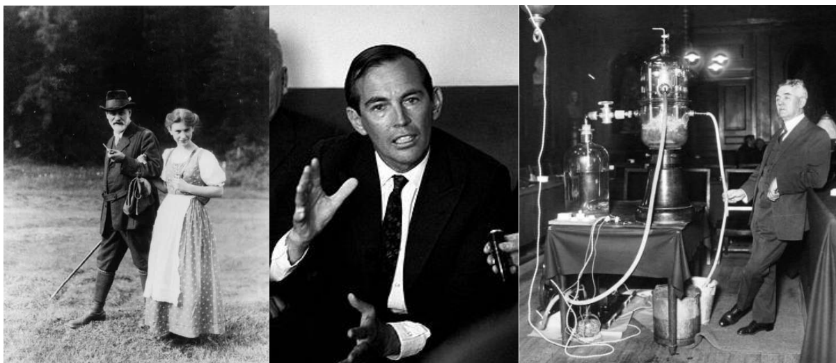
فروید و دخترش آنا