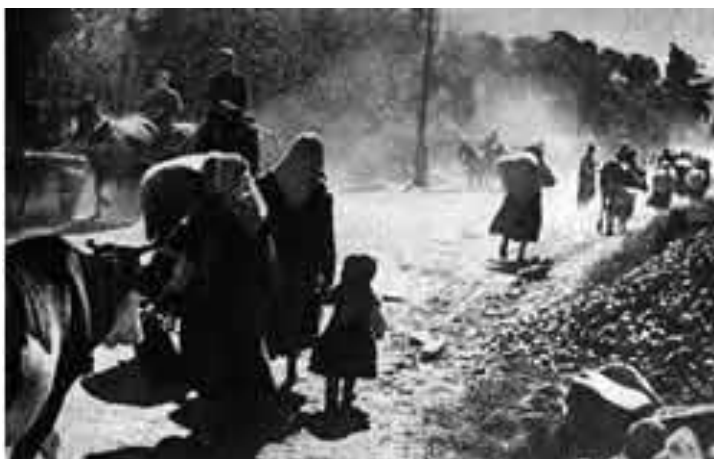
آوارگان ارمنی در جریان جنگ ارمنستان و ترکیه

این روز در عصر رضاشاهی با چند رخداد قرین بوده است. یکی آن که در سال ۱۳۱۱ شرکت نفت انگلیس و ایران اقدام دولت ایران را مبنی بر لغو قرارداد داری غیرقانونی دانست و به تصمیم رضا شاه و مجلس ایران در این مورد اعتراض کرد. در ۱۳۱۳ قانون اصلاح لباس به تصویب رسید و بر مبنای آن قرار شد لباسهایی که نمادهای مذهبی دارند مگر در زمان اجرای آیینهای مذهبی پوشیده نشوند. در سالهای اخیر هم در چنین روزی به سال ۱۳۵۰ پاکستان غافلگیرانه به هند حمله کرد و جنگ بین دو کشور شروع شد، و در ۱۳۵۸ آیت‌الله خمینی به طور رسمی رهبری دولت ایران را بر عهده گرفت.