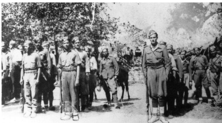
اعضای ارتش آزادیبخش خلق یونان