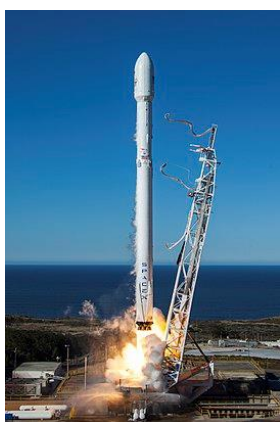
پرتاب شاهین ۹

در هفدهم آذر سال ۱۳۰۱ ایرلند شمالی خود را بخشی از انگلستان دانست و حاضر نشد بخشی از ایرلند جنوبی باشد، در ۱۳۲۰ ارتش ژاپن پس از نابود کردن قوای آمریکا در پرل هابر همزمان به تایلند، فیلیپین، مالزی، شانگهای، هنگ کنگ و قلمرو زیر فرمان کمپانی هند شرقی هلند (اندونزی) حمله بردند. در ۱۳۳۴ شورای اروپا پرچم اروپای متحد را تصویب کرد و در ۱۳۶۴ شورای همکاری آسیای جنوبی تشکیل شد. در ۱۳۷۰ هم رهبران روسیه، بلاروس و اوکراین طی عهدنامه‌ای اتحاد جماهیر شوروی را منحل اعلام کردند و به جای آن اتحادیه‌ی کشورهای مشترک‌المنافع را تاسیس کردند.