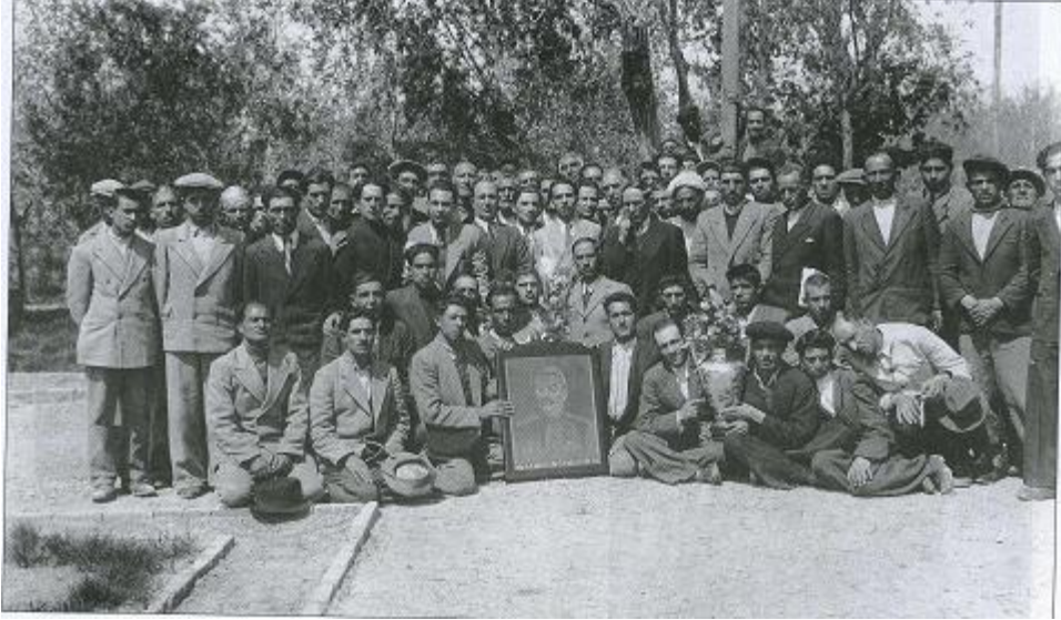
اعضای فرقه‌ی دموکرات آذربایجان با عکس استالین!

روز هفدهم آذرماه سال ۱۲۷۲ زهرا خانم تاج السلطنه دختر ناصرالدین شاه با امیرحسین خان شجاع‌السلطنه ازدواج کرد! پانزده سال بعد (۱۲۸۷) در چهارشنبه‌روزی مشروطه‌خواهان پس از شکست دادن مستبدین و کنار زدن محمدعلی شاه به سازندگی روی آوردند و در این روز مریضخانه‌ی ملی تبریز را افتتاح کردند و این مصادف بود با بازگشت سید حسن تقی‌زاده مشروطه‌خواه نامدار که ورودش به تبریز با استقبال زیاد مردم روبرو شد.