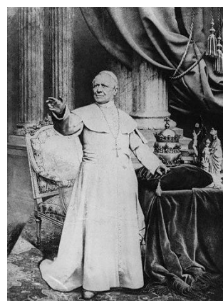
پاپ پیوس نهم

در چنین روزی به سال ۱۲۳۳ پاپ پیوس نهم در فرمان Ineffabilis Deus اعلام کرد که حضرت مریم معصوم بوده و از گناه نخستین مبرا بوده است! همین پاپ ده سال بعد در ۱۲۴۳ هم فرمان Quanta cura را به همراه پیوستی منتشر کرد و در آن فهرستی از گناهان را عرضه کرد که هسته‌ی مرکزی‌اش به آزادی‌خواهی و اندیشه‌های لیبرالی مربوط می‌شد!