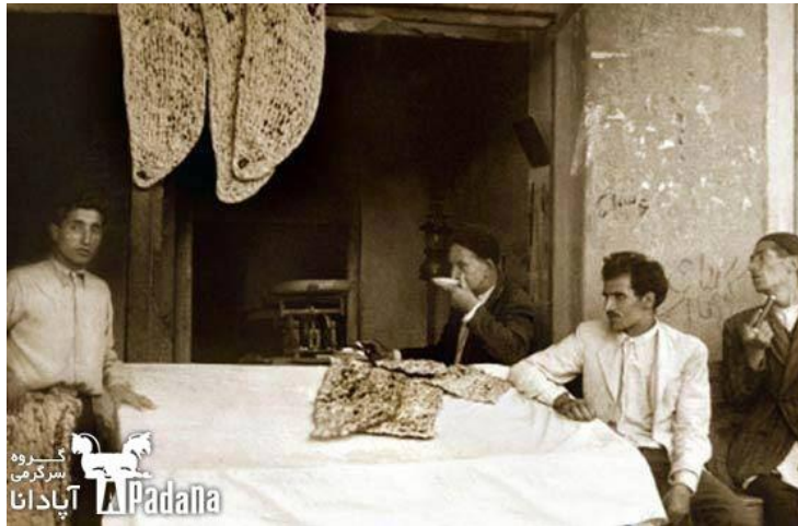
نانوایی در دهه‌ی ۱۳۲۰

هجدهم آذرماه در تاریخ ایران زمین روزی پرماجرا بوده است. بخشی از این داستان به پیوند این روز با زایش و مرگ شخصیت‌های نامدار مربوط می‌شود. چون در این روز به سال ۱۲۷ هجری خورشیدی بود که نصر بن سیار آخرین حاکم اموی خراسان در حالی که پس از نبردهای پیاپی از ابومسلم خراسانی به سوی همدان می‌گریخت در راه بیمار شد و مرد و به این ترتیب چیرگی خراسانیان بر اعراب قطعیت یافت. درست سیصد سال بعد در ۴۲۷ ابوریحان بیرونی دانشمند و مردم‌شناس ایرانی درگذشت و روز پنجشنبه هجدهم آذر سال ۶۳۴ محمد سوم امام نزاری‌ها جان سپرد. در همین روز به سال ۱۰۹ خزرها به رهبری بارجیک در نبرد مرج اردبیل بر ارتش مهاجم اموی که ۲۵ هزار سرباز داشت غلبه کردند و فرماندهش ابوعمقه جراح بن عبدالله حکمی را در میدان نبرد کشتند.