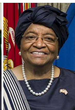
الن جانسون سیرلیف

این روز در عرصه‌ی فرهنگ نیز مهم بوده است. در دوم آذرماه سال ۵۳۴ پیش از میلاد تسپیس اهل ایکاریا در تاریخ ثبت شده‌مان نخستین کسی بود که هنگام خواندن شعرهای داستانی در قالب شخصیت‌های داستانی فرو می‌رفت و نقش آنها را بازی می‌کرد. این روش البته بی‌شک قدمتی به اندازه‌ی تاریخ بشر دارد اما این نخستین کسی است که نامش برای انجام این کار در تاریخ ثبت شده است.