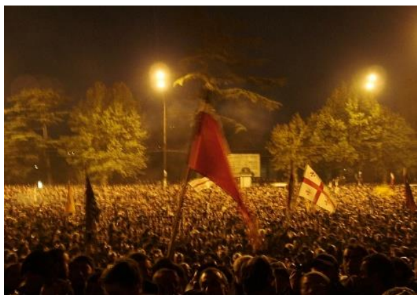
انقلاب گل سرخ گرجستان