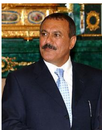
علی عبدالله صالح