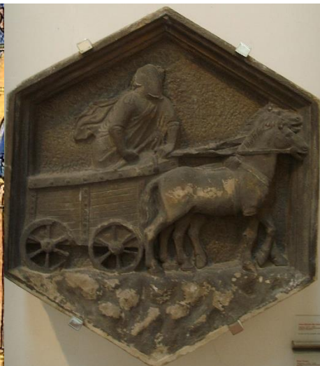
تسپیس اهل ایکاریا

در سطح جهانی این روز با چندین رخداد سیاسی قرین بوده است. در ۶۲۷ فردیناند سوم شاه کاستیل شهر سویل را گرفت، در ۱۱۱۲ بردگان سیاهپوستی که برای کار در مزارع از غنا به جزایر سنت جان در آمریکا برده شده بودند، بر اربابانشان که وابسته به شرکت هند غربی هلند بودند شوریدند و تا چند ماه در برابر برده‌داران مقاومت ورزیدند. در ۱۲۸۹ یوهان آلفرد آندره آخرین کسی بود که در سوئد اعدام شد، و در ۱۳۱۹ رومانی در جنگ جهانی دوم به قوای محور پیوست.