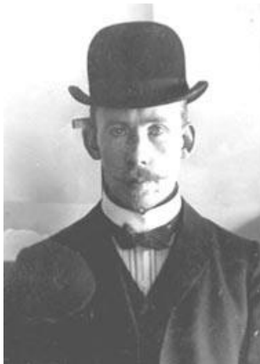
یوهان آلفرد آندره