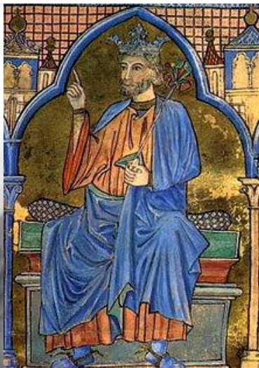
فردیناند سوم کاستیل