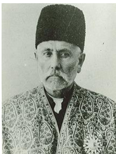
صمصام السلطنه و ورود آلنبی به اورشلیم