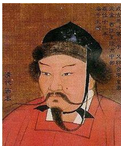
راست: اوگدای خان