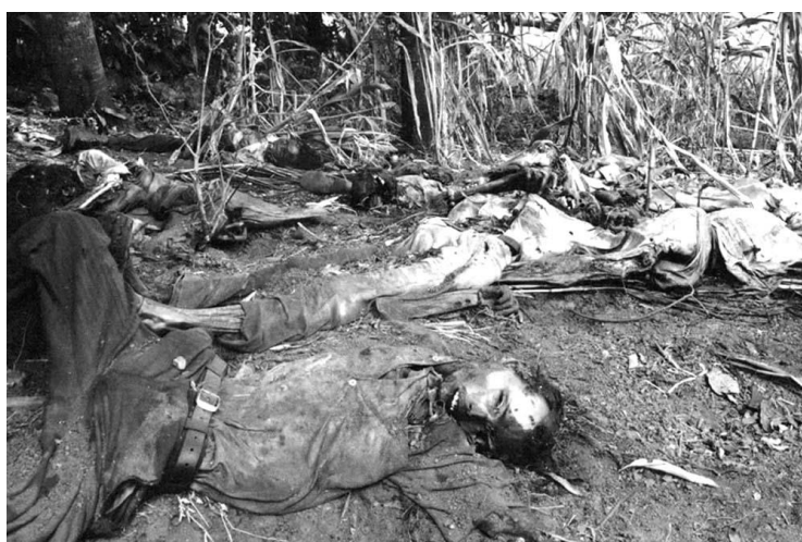
کشتار ال مونزوتِه

در ۱۳۶۰ قوای مسلح در السالوادور در جریان مبارزه با چریکهای مخالف دولت نهصد شهروند غیرنظامی را در شهر ال مونزوتِه کشتار کردند و در ۱۳۶۹ تظاهرات مردمی بر ضد حاکمیت کمونیسم در آلبانی آغاز شد و پس از زمانی کوتاه به سرنگوهی نظام کمونیستی منتهی شد. در ۱۳۷۳ هم بوریس یلتسین دستور داد ارتش روسیه به چین حمله کند.