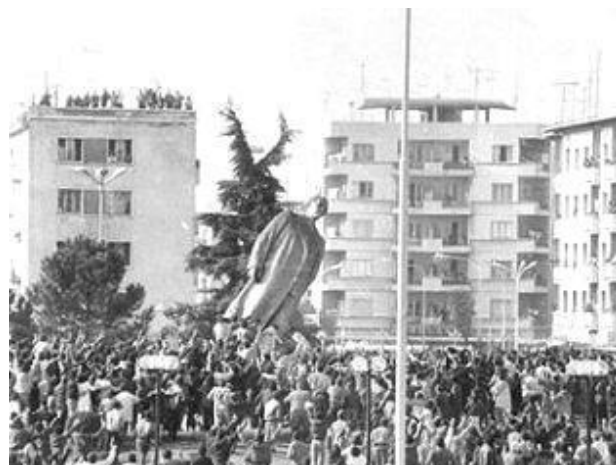
شورش ضد کمونیستی مردم آلبانی

در ۱۳۶۰ قوای مسلح در السالوادور در جریان مبارزه با چریکهای مخالف دولت نهصد شهروند غیرنظامی را در شهر ال مونزوتِه کشتار کردند و در ۱۳۶۹ تظاهرات مردمی بر ضد حاکمیت کمونیسم در آلبانی آغاز شد و پس از زمانی کوتاه به سرنگوهی نظام کمونیستی منتهی شد. در ۱۳۷۳ هم بوریس یلتسین دستور داد ارتش روسیه به چین حمله کند.