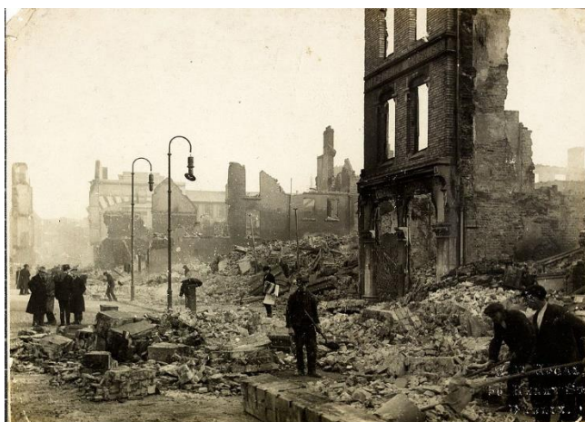
ویرانی شهر کورک

هم به دنبال سفر شارل دوگل به الجزایر و تظاهرات گسترده‌ی مخالفان استعمار، نیروهای امنیتی فرانسه دچار اغتشاش شدند.