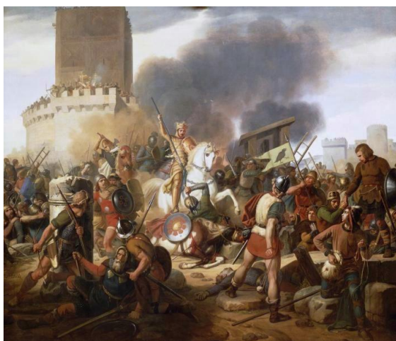
حمله‌ی وایکینگها به پاریس