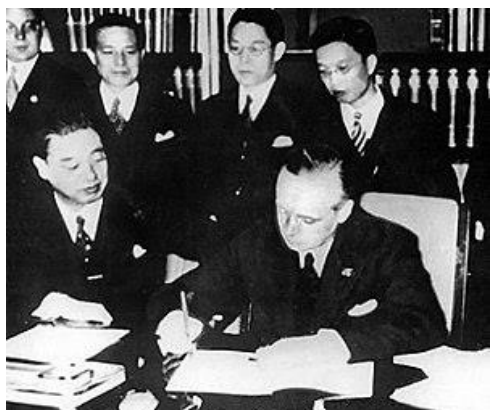
قرارداد ضد کمیتن ژاپن و آلمان

در ۱۳۵۴ سورینام از هلند استقلال یافت، در ۱۳۶۵ مقامات رسمی آمریکا فاش کردند که پول به دست آمده از فروش اسلحه به ایران صرف پشتیبانی مالی از شورشیان کنترا در نیکاراگوا می شده است، و در ۱۳۷۱ مجلس فدرال چکسلواکی حکم کرد که این کشور به دو کشور متمایز جمهوری چک و اسلواکی تقسیم شود.