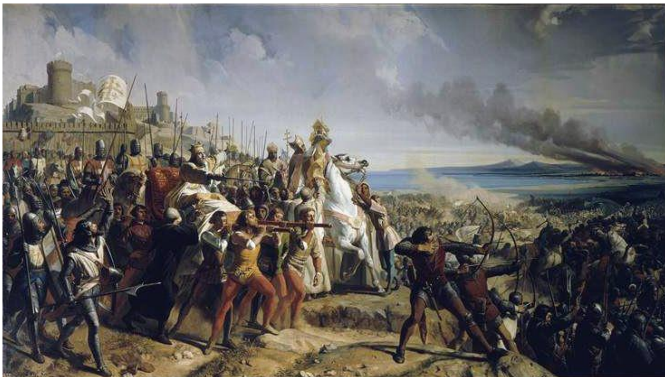
نبرد مونت گیسارد

چهارم آذر ماه در تاریخ سیاسی جهان هم برجستگی ای دارد. بنا به روایت‌های رومی در چنین روزی در سال ۵۷۱ پیش از میلاد سرویوس تولیوس رهبر مردم رم پیروزی‌اش بر مردم اتروسک را جشن گرفت. در ۲۶۴ هجری خورشیدی سیرد کشتی وایکینگ از رود رن گذشتند و پاریس را در محاصره گرفتند اما در نهایت در گرفتن شهر ناکام ماندند، دو رخداد این روز هم به چیرگی سپاهیان مسیحی بر مسلمانان مربوط می‌شود: در ۵۵۶ هم بالدوین شاه اورشلیم و راینالد اهل شاتیون رهبر شهسواران معبدی قوای صلاح‌الدین ایوبی را در نبرد مونت‌گیسارد (احتمالا جزر در نزدیکی رمله) شکست دادند. در ۸۷۰ محاصره‌ی گرانادا که واپسین دولت مسلمانان در اسپانیا بود با تسلیم شدن امیر ابو عبدالله محمد و عقد قرارداد گرانادا به پایان رسید