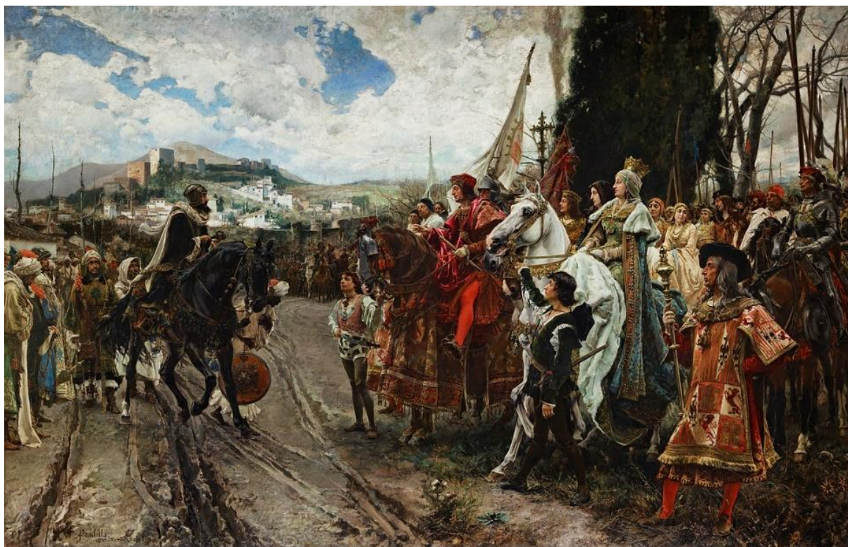
تسلیم امیر گرانادا به مسیحیان

این روز در ضمن با شکل گرفتن کشور ایالات متحده هم پیوند خورده است. در ۱۱۶۲ آخرین سربازان برتانیایی به دنبال امضای قرارداد پاریس شهر نیویورک را ترک کردند، در ۱۲۵۵ قوای ارتش ایالات متحده پس از شکست خوردن در نبرد لیتل بیگ هورن، ناغافل به روستاهای سرخپوستان شایان حمله بردند و آنان را کشتار کردند. گرانیگاه دیگر وقایع سیاسی این روز به آلمان و ژاپن مربوط می شود. چون در ۱۲۹۶ ارتش آلمان قوای پرتغال را در نبرد نگومانو در مرز موزامبیک و تانزانیا شکست دادند، در ۱۳۱۵ ژاپن و آلمان در برلین پیمان ضدکمیترون را برای مقابله با نفوذ کمونیستها در سیاست کشورهایشان امضا کردند، و در ۱۳۴۹ یوکیو میشیما شاعر، نویسنده و کارگردان نامدار ژاپنی پس از آن که به همراه چند تن از دوستان افسرش کودتایی نمادین انجام داد و کوشید قدرتهای سابق را به مقام امپراتور بازگرداند، شکست خورد و پس از سخنرانی پرشوری به شیوهی سنتی ژاپنیا (سپوکو) شکم خود را با شمشیر درید و خودکشی کرد.