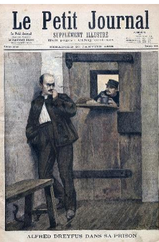
دریفوس در زندان