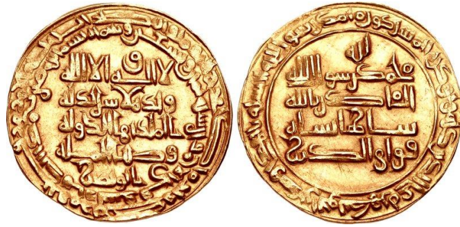
سکه‌ی پیروز خرشاد دیلمی

در چنین روزی به سال ۲۴۴ میلادی دیوکلتیان امپراتور روم زاده شد و در ۵۶۲ هجری خورشیدی