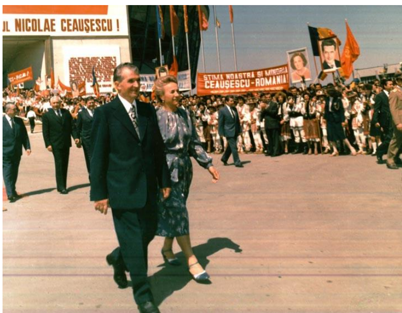
چائوشسکو در زمانی که کیش شخصیت‌اش برپا بود

این روز در ضمن برای جنبش جهانی کمونیسم روزی ناگوار بوده است. در سال ۱۳۵۷ یازدهمین پلنوم ملی حزب کمونیست چین در پکن برگزار شد و در آن دنگ شیائو پینگ سیاست فاجعه‌بار دوران مائو را کنار گذاشت و از اصلاحات اقتصادی که به معنای عقب‌نشینی از اصول کمونیسم بود پشتیبانی کرد. در ۱۳۶۸ شورش مردم رومانی به رهبری یون ایلیسکو پس از درگیری‌هایی خونین به پیروزی رسید و نیکولای چائوشسکو و همسرش سوار بر بالگرد از بخارست گریختند. در نتیجه سیطره‌ی حزب کمونیست رومانی پایان یافت و مردم جشن بزرگی به پا کردند. در همین روز دروازه‌ی براندنبرگ در برلین گشوده شد و به جدایی برلین شرقی و غربی پایان داد. یک سال بعد (۱۳۶۹) همین ماجرا در لهستان هم به نهایت رسید و لخ والسا به ریاست جمهوری لهستان برگزیده شد.