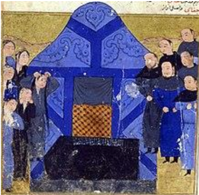
جغتای خان مغول

انگلیسی (۱۲۵۹)، و ریچارد فن کرافت ایبینگ روانشناس آلمانی (۱۲۸۱) که در این روز در گذشته‌اند.