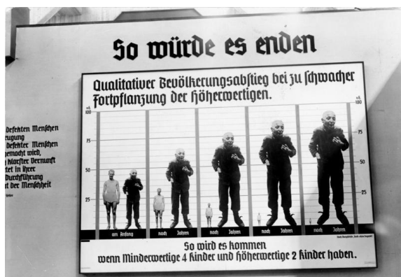
پوستر برنامه‌ی بهنژادی نازی‌ها