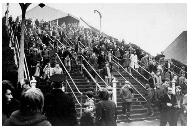
بالا: ورزشگاه بازی فوتبال تیم‌های رنجرز و سلتيک پیش از اغتشاش