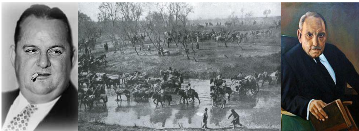
خوزه آنتونیو رمون کانرا

در سال ۱۲۸۴ سربازان روسی در قرارگاهشان واقع در پورت آرتور تسلیم سربازان ژاپنی شدند، در ۱۲۹۹ دومین حمله‌ی پالمر به دستگیری شش هزار کمونیست و آنارشویست در آمریکا منتهی شد که در نهایت به اخراج اکثرشان از آمریکا انجامید، در ۱۳۲۱ ژاپنی‌ها مانیل را در فیلیپین گرفتند، در ۱۳۲۴ نیروی هوایی متفقین با بمباران نقطه‌ای شهر نورنبرگ را به کلی ویران کرد، و در ۱۳۲۸ لوئیس مونوز مارین اولین دولتمرد پورتوریکویی بود که به دنبال انتخاباتی دموکراتیک به قدرت رسید. در سال ۱۳۳۴ خوزه آنتونیو رمون کانرا رئیس جمهور پاناما ترور شد، در ۱۳۴۲ نیروهای ویت‌کنگ اولین پیروزی مهم‌شان در جنگ به دست آوردند، و در ۱۳۴۶ رونالد ریگان فرماندار کالیفرنیا شد و این آغازگاه ارتقای سیاسی او تا مقام ریاست جمهوری بود.