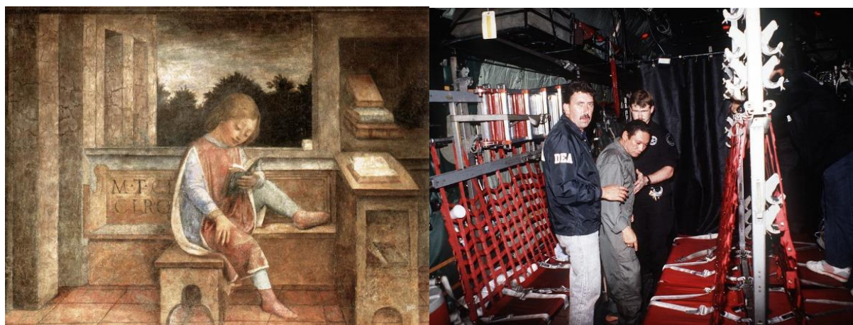
سیسرو در کودکی

چندین رخداد پراکنده اما مهم دیگر هم در این روز واقع شده‌اند. در سال ۱۲۴۹ ساخت پل بروکلین آغاز شد که یکی از شاهکارهای مهندسی دوران خود بود، در ۱۳۲۶ برای نخستین بار مذاکرات کنگره‌ی آمریکا از تلویزیون پخش شد، و در ۱۳۲۸ بانک مرکزی فیلیپین تاسیس شد. در سال ۱۳۳۵ بخش بالایی برج ایفل در اثر آتش‌سوزی تخریب شد، در ۱۳۳۶ شرکت همیلتون برای نخستین بار ساعت مچی باتری‌دار به بازار عرضه کرد که با نیروی الکتریسیته کار می‌کرد، و در ۱۳۵۶ هم شرکت رایانه‌ی اپل تاسیس شد.