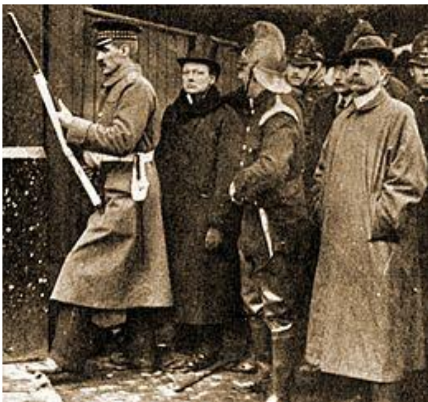
چرچیل و سربازان در درگیری مسلحانه‌ی شرق لندن

بیش از دو هزار ساکنان آن را به قتل رساندند.