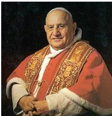
پاپ جان ۲۳