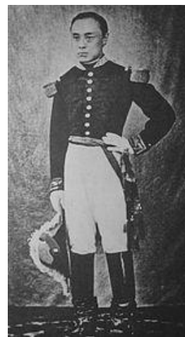
توکوگاوا یوشی نوبو

در تاریخ سیاسی جهان سیزدهم دی ماه با چند رخداد گره خورده است. در سال ۱۲۲۷ جوزف جنکینز