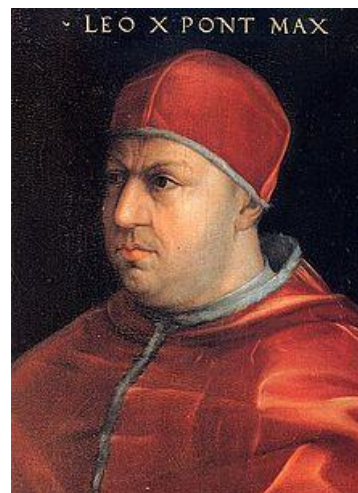
پاپ لئوی دهم

سیزدهم دی در تاریخ کلیسا با صدور سه سند مهم مصادف بوده است. یکی به سال ۹۰۰ که در آن