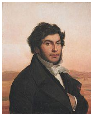
ژان فرانسوا شامپولون