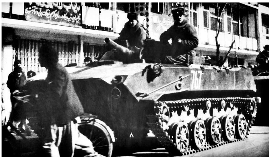
ورود ارتش سرخ به کابل