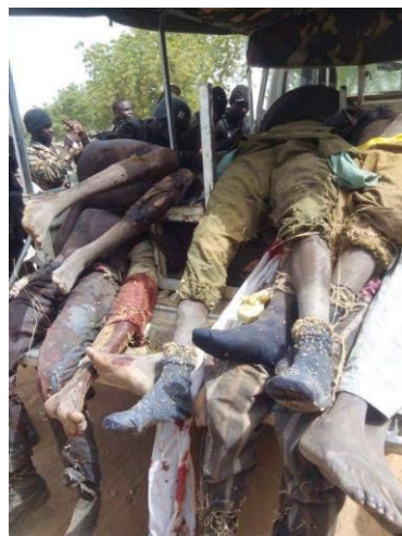
نخش مردان بوکوحرام

این روز در تاریخ نهادهای اجتماعی هم اهمیتی داشته است. در ۱۲۴۵ انجمن سلطنتی هوانوردی در