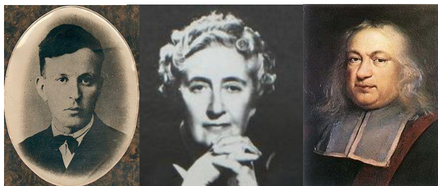
راست: پیر دو فرما

(۱۰۴۴) و آگاتا کریستی (۱۳۵۵) هم در این روز جان سپرده‌اند.