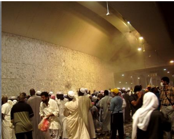
رمی جمرات لحظاتی پیش از حادثه