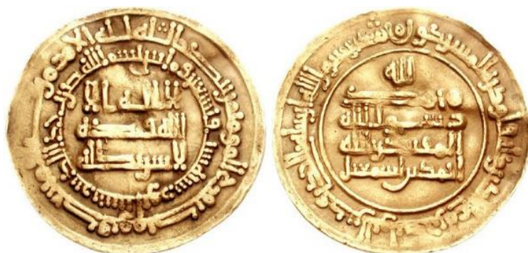
سکه‌ی امیر احمد