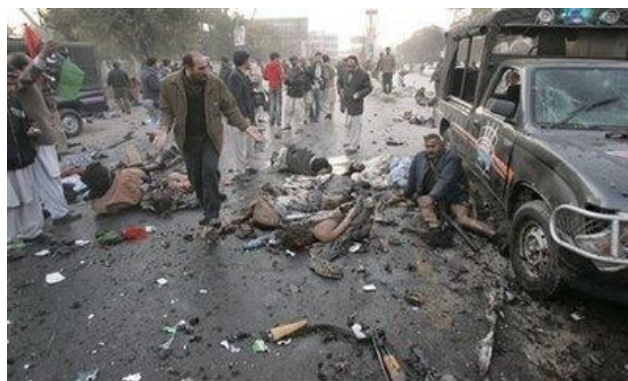
ترور بینظیر بوتو

ششم دی در تاریخ معاصرمان با رخدادهایی فاجعه‌بار هم مصادف بوده که بیشتر در گرداگرد قلمرو ایران زمین و خارج از مرزهای کشور کنونی ایران رخ داده است. در ۱۳۱۸ زلزله‌ی ارزنجان در ترکیه به ویرانی کامل منطقه و مرگ دست کم ۳۲۷۰۰ تن انجامید، در ۱۳۵۸ ارتش سرخ شوروی به افغانستان حمله کرد، و در ۱۳۷۵ نیروهای طالبان فرودگاه بگرام را اشغال کردند و در اطراف کابل به موقعیت برتر دست یافتند. در ۱۳۸۱ هم دو کامیون حامل مواد منفجره در نزدیکی مقر روسها در گروزنی منفجر شد و ۷۲ تن از هواداران روسیه در چچن را به قتل رساند و دویست تن دیگر را زخمی کرد. در سال ۱۳۸۶ بینظیر بوتو نخست‌وزیر پیشین پاکستان ترور شد و به قتل رسید و در ۱۳۸۸ در جریان اعتراضها به نتایج انتخابات ریاست جمهوری، مردمی که برای راهپیمایی روز عاشورا به خیابانها آمده بودند، مورد حمله قرار گرفتند و گروهی کشته و زخمی شدند.