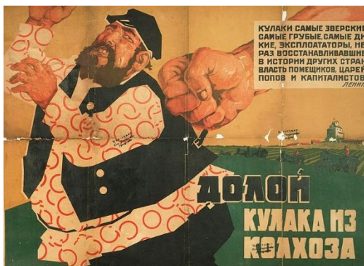
پوستر دولت استالینی برای توجیه کشتار کولاک‌ها