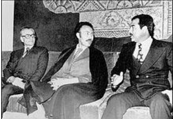
حواری بومدین، صدام و شاه

دموکرات و دومین رئیس جمهور افغانستان در جریان حمله‌ی کمونیستها به کابل کشته شد.