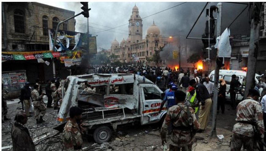
بمب‌گذاری عاشورای کراچی

جریان بمب‌گذاری در کراچی پاکستان ۴۳ نفر از شیعیانی که مراسم عاشورا را برگزار می‌کردند کشته و شمار بیشتری زخمی شدند.