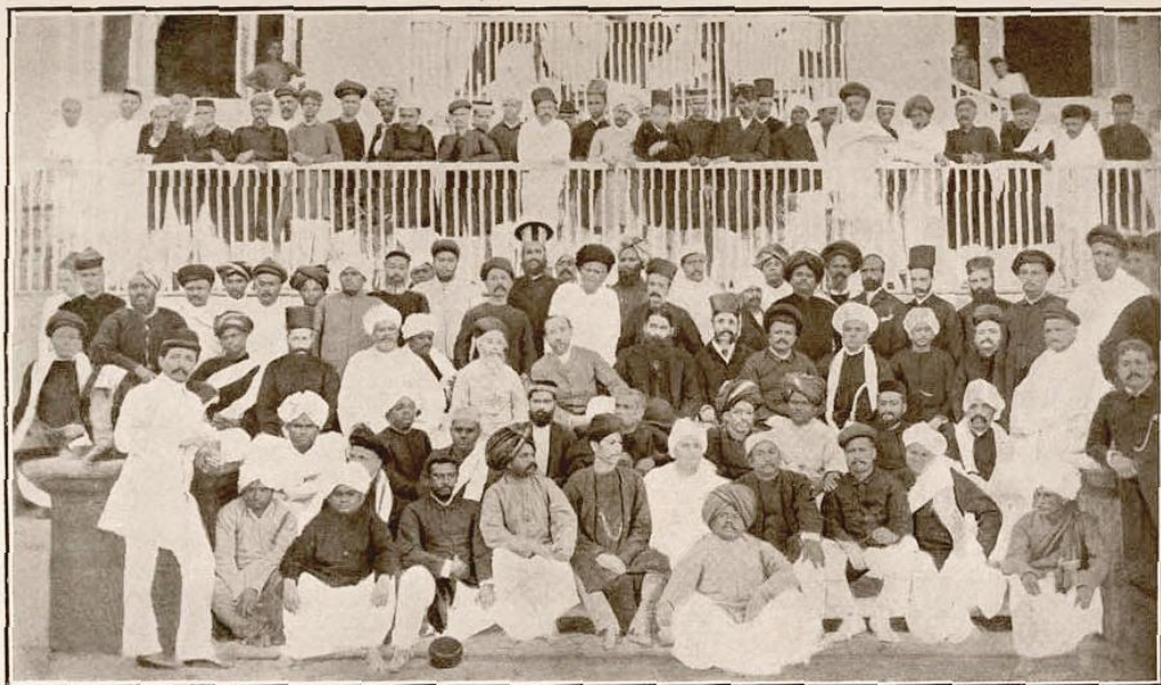
THE FIRST INDIAN NATIONAL CONGRESS, 1885.

قدیمی ترین رخداد تاریخی مهم ثبت شده در این روز به سال ۵۲۲ پ.م رخ داد و آن زمانی بود که بهترداد پارسی (وهیزداته) که رقیب اصلی داریوش بر سر تاج و تخت هخامنشی بود در منطقه‌ی تاروای پارس شکست خورد و کشته شد. چهارده قرن بعد در سال ۲۷۲ هجری خورشیدی در همین روز زمین لرزه شهر دوین پایتخت استان قدیم ارمنستان را ویران کرد. دوین در زبان پهلوی یعنی تپه و در سال ۳۳۵ م در نزدیکی شهر قدیمی آرتاخشاتا (اردشیر آباد) به دست خسروی سوم حاکم اشکانی ارمنستان تاسیس شده بود. این شهر تا زمان حمله‌ی اعراب بیش از صد هزار تن جمعیت داشت. در سال ۱۹ هجری خورشیدی غلبه‌ی اعراب بر شهر به کشته شدن دوازده هزار تن و به بردگی گرفته شدن سی و پنج هزار تن دیگر انجامید، ولی