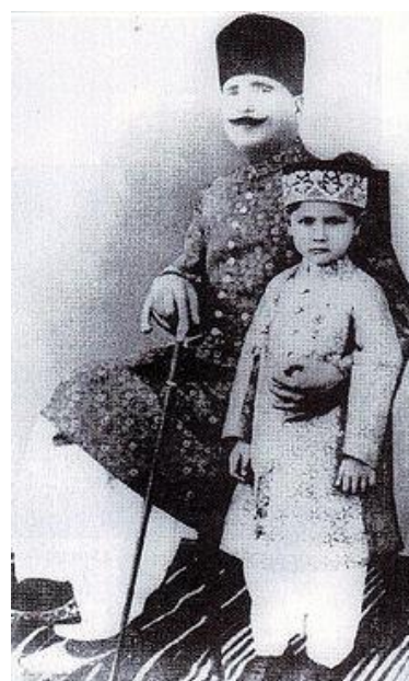
علامه اقبال لاهوری و پسرش

سه رخداد جالب توجه دیگر این روز آن که در سال ۱۲۹۵ اولین کتاب جیمز جویس به نام «سیمای هنرمندی در جوانی» با همت یک ناشر آمریکایی به چاپ رسید، و در ۱۳۸۵ انگلستان بدهی‌هایی که بابت