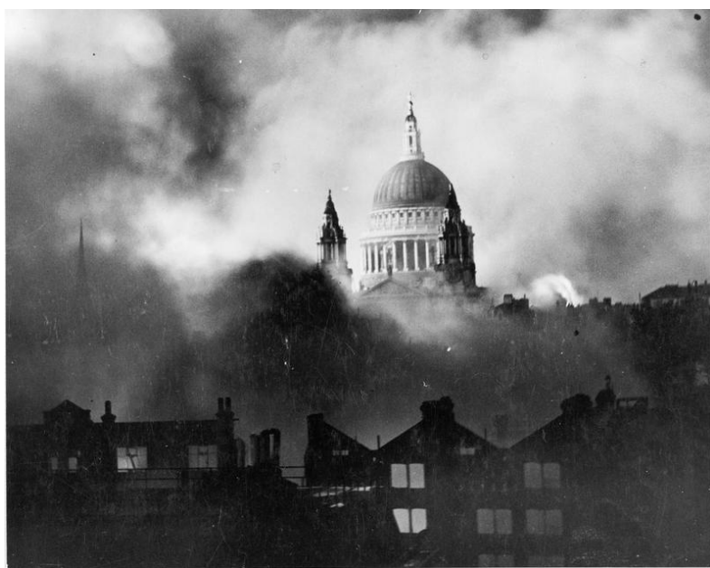
بمباران لندن و آتش‌سوزی بزرگ

در سال ۱۳۱۹ در یکی از مهیبترین بمباران‌های لندن که توسط نیروی هوایی آلمان انجام گرفت، به حریق بزرگ لندن منتهی شد که در آن حدود ۱۶۰ نفر به قتل رسیدند. نیروی هوایی انگلستان در مقام تلافی تا سه سال بعد به روشی برای بمباران نقطه‌ای شهرهای آلمانی روی آورد. در ۱۳۶۸ پس از سرنگونی دولت کمونیستی در چکسلواکی، واسلاو هاول فیلسوف و نویسنده به عنوان رئیس جمهور انتخاب شد و در ۱۳۷۷ رهبران خمرهای سرخ بابت نسل‌کشی‌ها و کشتارهای بیست سال قبلشان در کامبوج از بازمانده‌ی مردم این کشور پوزش خواستند!