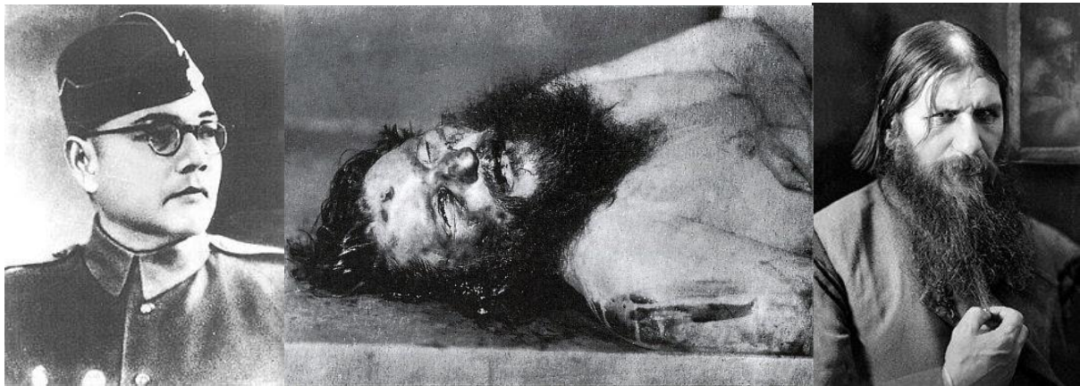
راسپوتین در زمان اقتدار (راست) و پس از مرگش (چپ)، سوبهاس چندرا بوز (چپ)

در تاریخ جهان این روز با چندین رخداد خشونت‌بار مصادف بوده است. در سال ۴۴۵ غوغای توده‌ای مردم در گرانادا به خشونت انجامید و گروهی از مردم به سراغ وزیر اعظم سلطان گرانادا ابوحسین یوسف بن نغریله که یهودی بود رفتند و او را به صلیب کشیدند. در این هنگام ۱۵۰۰ خانوار یهودی در گرانادا زندگی می‌کردند که برخی از ایشان هم مورد تعرض این عده قرار گرفتند. این یکی از موارد استثنایی حمله‌ی خشونت‌آمیز مردم به یهودیان در قلمرو اسلامی است.