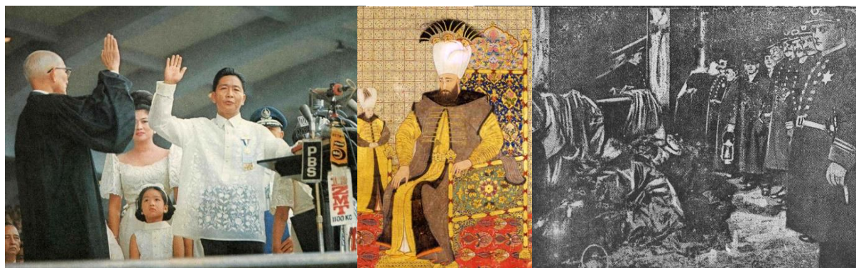
سوگند ریاست جمهوری فردیناند مارکوس

بیش از ششصد نفر منتهی شد، و در ۱۳۰۶ اولین خط متروی آسیا در توکیو گشایش یافت.