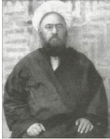
ثقه الاسلام تبریزی