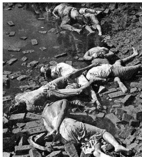
کشتار بنگالی‌ها در پاکستان

در بیست و سوم آذر ماه سال ۹۲۱ پرنسس مری استوارت ملکه‌ی اسکاتلند شد، در ۱۱۹۱ آخرین سربازان فرانسوی ناپلئون از خاک روسیه عقب نشستند، و در ۱۱۹۸ آلاباما بیست و دومین ایالت آمریکا شد. در ۱۲۹۷ فنلاندی‌ها شاهزاده‌ای آلمانی به نام فریدریش کارل فون هسن را به پادشاهی خود برگزیدند و در همین روز رئیس جمهور پرتغال سیدونیوس پائیس ترور شد و به قتل رسید. در ۱۳۱۸ هم اتحاد جماهیر شوروی به خاطر حمله به فنلاند از سازمان ملل اخراج شد.