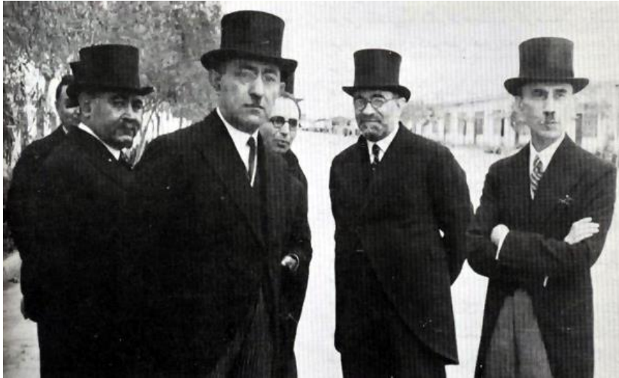
فروغی و مشاورالممالک در پاریس

روز سه‌شنبه بیست و سوم آذر سال ۵۱۰ هجری خورشیدی ابوعلی احمد رهبر شیعیان به دست سپاهیان خلیفه‌ی فاطمی مصر الحافظ‌الدین الله که امام فرقه‌ی حافظیه بود، کشته شد. به همین خاطر این روز را تا پایان دوران زمامداری فاطمیان به اسم عیدالنصر جشن می‌گرفتند.