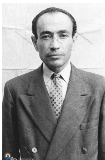
دکتر حمیدی شیرازی

در سال ۱۳۳۰ دکتر حمیدی شیرازی شاعر نامدار که برای مدتی از مردم کناره گرفته و به کشاورزی و باغبانی مشغول بود، از این کار دست کشید و بار دیگر به شاعری روی آورد و شاهکارهایی ماندگار آفرید.