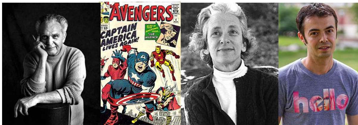
کیربی و نمونه‌ای از نقاشی‌هایش

در میان انیرانیان رونالد ریگان (۱۲۹۰)، اوا براون همسر هیتلر (۱۲۹۱) و فرانسوا تروفو کارگردان فرانسوی (۱۳۱۱) در این روز زاده شده‌اند و بارابار تاکمن مورخ آمریکایی (۱۳۶۸) و جک کیربی نویسنده و نقاش کمیک استریپ آمریکایی (۱۳۷۳) در این روز در گذشته‌اند.