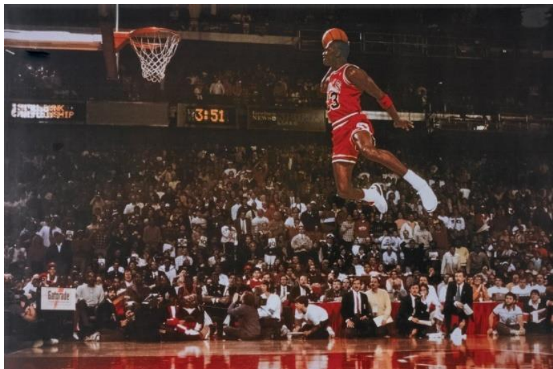
حرکت مشهور مایکل جردن