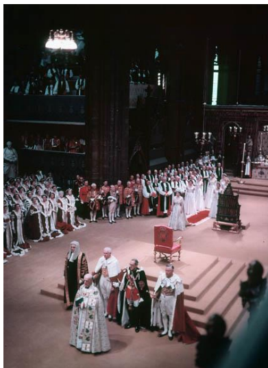
تاجگذاری ملکه الیزابت دوم

این روز در تاریخ آمریکا با رخدادهایی فرهنگی و اجتماعی مصادف بوده است. در سال ۱۲۲۲ اولین نمایش کمدی minstrel show که در آن هنرپیشگانی سپیدپوست با گریم در نقش سیاهپوستان فرو می‌رفتند و وابستگان به این نژاد را مسخره می‌کردند، در آمریکا بر صحنه رفت، در ۱۳۳۸ جک کیلی مدار «منسجم» IC (integrated circuit) را اختراع کرد، در ۱۳۳۸ آمریکایی‌ها از پایگاه کیپ کاناورال اولین موشک قاره‌پیمای خود به نام تیتان را به هوا فرستادند، و در ۱۳۶۷ مایکل جردن با حرکت slam dunk (پرش بلند و انداختن توپ از فاصله‌ی اندک به درون تور) در بازی بسکتبال به شهرت رسید.