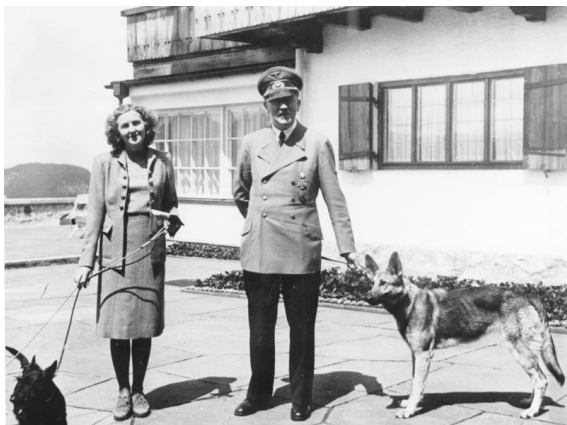
هیتلر و اوا براون

در میان مردم ایران زمین محمد ظفرالله خان دولتمرد پاکستانی و اولین وزیر امور خارجه‌ی این کشور در سال ۱۲۷۲ و اورکوت بیوک کوکتین بنیانگذار شبکه‌ی اجتماعی اورکوت به سال ۱۳۵۴ در قونیه زاده شدند و در همین روز به سال ۲۲۲ هجری خورشیدی هشام بن عبدالملک خلیفه‌ی اموی (سکه‌اش در تصویر روبرو) و در ۱۰۷۴ سلطان احمد دوم عثمانی درگذشتند.