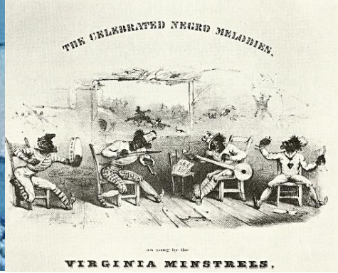
آگهی یک نمایش کمدی مینتسرل