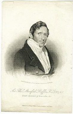
توماس استنفورد رافلز