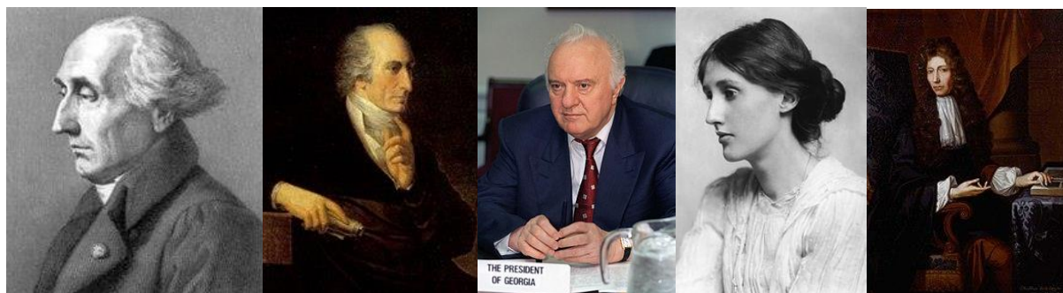
ژوزف لویی لاگرانژ

سلطان ملکه‌ی عثمانی (۹۵۷) و علی حسن‌المجید تک‌ریتی (۱۳۸۹) مشهور به علی شیمیایی پسرعموی صدام حسین و وزیر جنگ عراق که بمباران شیمیایی مخالفان صدام را مدیریت می‌کرد.