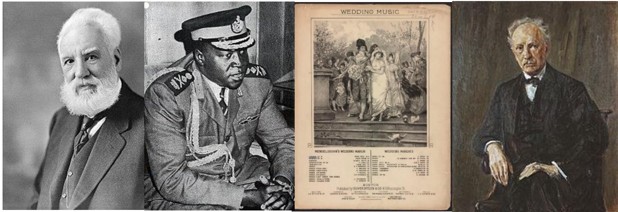
الکساندر گراهام بل