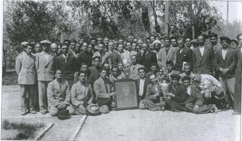
اعضای فرقه‌ی دموکرات آذربایجان با عکس استالین

در چنین روزی به سال ۱۲۹ هجری خورشیدی سپاهیان خراسانی و شیعیان با رهبری عبدالله بن علی و ابوعون در نبرد زاب در حوالی اربیل بر نیروهای اموی پیروز شدند و به این ترتیب میان‌پرده‌ی ناخوشایند دوران بنی امیه در تاریخ ایران زمین از سر گذشت. سپاه شورشیان سی و پنج هزار تن و سپاه امویان که زیر فرمان خلیفه مروان دوم (حمار) می‌جنگید بین ۱۲۰ تا ۱۵۰ هزار تن عده داشت.