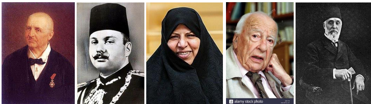
ملک فاروق هان گئورک گادامر مرضیه وحید دستجردی احمد توفیق پاشا آنتون بروکنر

در میان مردم حوزه‌ی تمدن ایرانی احمد توفیق پاشا صدراعظم عثمانی (۱۲۲۴) و مرضیه وحید دستجردی وزیر بهداشت (۱۳۳۸) در این روز زاده شده‌اند و علاءالدین بهمن شاه بنیانگذار دودمان بهمنی در دکن هند (۷۳۷) و فخرالدین علی احمد رئیس جمهور هند (۱۳۵۶) در این روز از دنیا رفته‌اند.