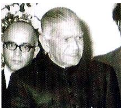
فخرالدین علی احمد

از میان انیرانیان زادگان نامدار بیست و دوم بهمن عبارتند از: توماس ادیسون (۱۲۲۶)، هانس گئورک گادامر فیلسوف آلمانی (۱۲۷۹)، ملک فاروق شاه مصر (۱۲۹۹)، و مانوئل نوریگا رهبر پاناما (۱۳۱۳). از میان رفتگان مشهور هم می‌توان از این نامها یاد کرد: هراکلیوس امپراتور روم (۲۰ هجری خورشیدی)، کارل فون تریر استاد اعظم فرقه‌ی تُتن‌ها (۷۰۳)، الکساندر گریبایدوف (۱۲۰۸)، سرگئی آیزنشتاین کارگردان روس (۱۳۲۷)، سیولویا پلات ادیب و شاعر آمریکایی (۱۳۴۲)، فرانک هربرت نویسنده‌ی رمانهای علمی تخیلی (۱۳۶۵) و پاول فایرآبند فیلسوف (۱۳۷۳).