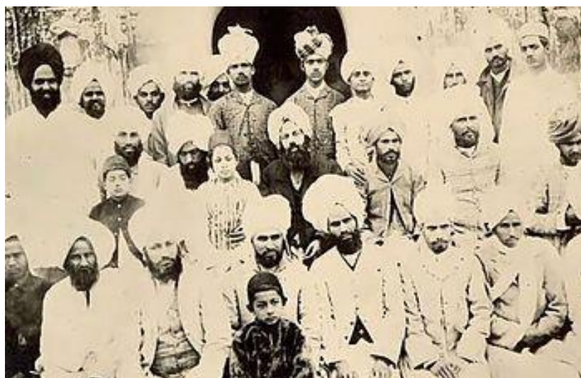
میرزا غلام احمد

بیست و چهارم بهمن در ضمن روز کشفهای شگفت‌انگیز و اعلامهای غریب هم هست. در چنین روزی به سال ۱۳۴۰ در یک اکتشاف بحث برانگیز، یک شمع موتور خودرو که در داخل یک تکه سنگ نیم میلیون ساله مومیایی شده بود کشف شد! این شمع‌ها در ابتدای قرن بیستم اختراع شدند و از آن هنگام نظریه‌های علمی و شبه‌علمی زیادی در این مورد که چطور چنین چیزی در میانه‌ی سنگی چنین قدیمی جای داشته پیشنهاد شده است. در ۱۳۴۶ پژوهشگران آمریکایی در کتابخانه‌ای در اسپانیا «متن مادرید» را یافتند که به قلم لئونارد داوینچی نوشته شده بود، و در ۱۳۸۳ بزرگترین الماس دنیا در فضا کشف شد و کوتوله‌ی سفیدی بود به نام BPM 37093 که به یاد آوازی از گروه بیتل‌ها آن را لوسی نامیدند. در سال ۱۳۸۷ هم کوین راد نخست وزیر استرالیا در نطقی تاریخی از بومیان این سرزمین به خاطر آن که منقرض‌شان کرده بودند عذرخواهی کرد!