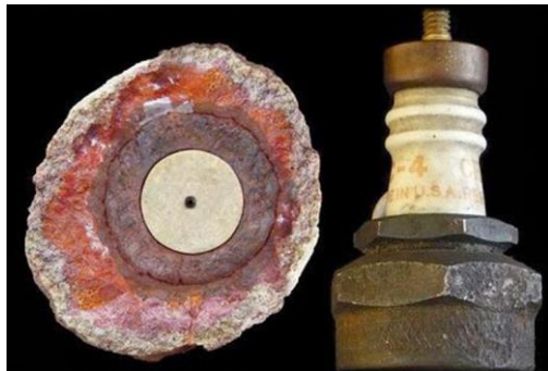
شمع موتور باستانی

بیست و چهارم بهمن در ضمن روز کشفهای شگفت‌انگیز و اعلامهای غریب هم هست. در چنین روزی به سال ۱۳۴۰ در یک اکتشاف بحث برانگیز، یک شمع موتور خودرو که در داخل یک تکه سنگ نیم میلیون ساله مومیایی شده بود کشف شد! این شمع‌ها در ابتدای قرن بیستم اختراع شدند و از آن هنگام نظریه‌های علمی و شبه‌علمی زیادی در این مورد که چطور چنین چیزی در میانه‌ی سنگی چنین قدیمی جای داشته پیشنهاد شده است. در ۱۳۴۶ پژوهشگران آمریکایی در کتابخانه‌ای در اسپانیا «متن مادرید» را یافتند که به قلم لئونارد داوینچی نوشته شده بود، و در ۱۳۸۳ بزرگترین الماس دنیا در فضا کشف شد و کوتوله‌ی سفیدی بود به نام BPM 37093 که به یاد آوازی از گروه بیتل‌ها آن را لوسی نامیدند. در سال ۱۳۸۷ هم کوین راد نخست وزیر استرالیا در نطقی تاریخی از بومیان این سرزمین به خاطر آن که منقرض‌شان کرده بودند عذرخواهی کرد!