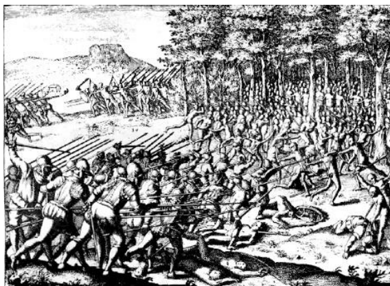
جنگ اسپانیایی ها و ماپوچه ها