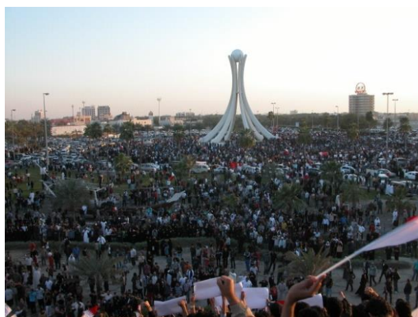
روز خشم در بحرین

در چنین روزی به سال ۱۳۳۰ نصرت‌الله قمی که گویا به گروه فداییان اسلام وابستگی‌ای داشته، دکتر عبدالحمید زنگنه وزیر فرهنگ کابینه‌ی رزم‌آرا را در دانشگاه تهران ترور کرد و به قتل رساند. در سال ۱۳۳۲ مدرسه‌ی آیت‌الله بروجردی در نجف گشایش یافت و در همین روز اولین خط تلفن بیسیم بین تهران و یزد افتتاح شد و مورد بهره‌برداری قرار گرفت. در ۱۳۳۹ دانشگاه ملی با دو دانشکده‌ی معماری و علوم مالی و اقتصادی کار خود را آغاز کرد و ریاست‌اش بر عهده‌ی دکتر علی شیخ‌الاسلام بود. در ۱۳۵۸ اعضای گروه مسلح ستم ملی در کابل سفیر آمریکا در افغانستان - آدولف دابز - را ربودند و بعدتر در جریان درگیری با پلیسها او را کشتند، درست ده سال بعد ۱۳۶۸ امام خمینی فتوا داد که سلمان رشدی مرتد است و باید به قتل برسد. در سال ۱۳۸۴ رفیق حریری میلیونر و دولتمرد لبنانی به همراه ۲۱ نفر دیگر در جریان بمب‌گذاری‌ای با حجم هزار کیلو تی ان تی به قتل رسید. در سال ۱۳۹۰ هم مردم بحرین در جریان موسوم به روز خشم سر به شورش برداشتند.