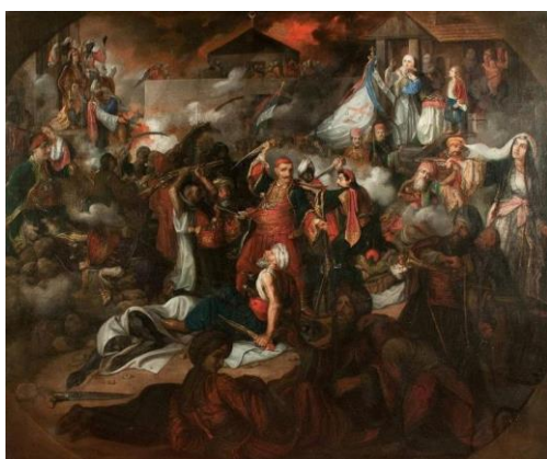
تعقیب دینی گرانادا

بیست و پنجم بهمن با چندین رخداد مذهبی در عالم مسیحیت مصادف بوده است. در سال ۳۹۳ پاپ بندیکت هشتم هنری باواریا شاه آلمان را در مقام امپراتور روم مقدس به رسمیت شمرد و تاج بر سرش نهاد، در ۴۵۵ پاپ گریگوری هفتم هنری چهارم امپراتور مقدس روم را تکفیر کرد، در ۷۲۸ متعصبان مسیحی در استراسبورگ چند صد یهودی را زنده زنده در آتش سوزاندند و باقی را از شهر بیرون راندند، و در ۸۸۱ فرمانروایان کاتولیک با اعمال نفوذ پاپ فرمانی صادر کردند و همه‌ی مسلمانان قلمرو اسپانیا و به ویژه گرانادا را به تغییر دین به آیین ترسایی کاتولیک تکلیف کردند.