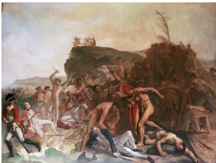
مرگ کاپیتان کوک