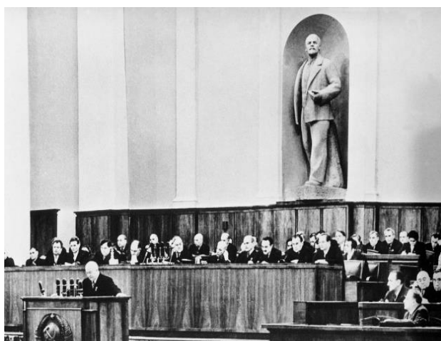
کنگره‌ی بیستم حزب کمونیست شوروی

در چنین روزی به سال ۱۲۹۸ جنگ روسیه‌ی شوروی و لهستان آغاز شد، در ۱۳۲۲ هانس یورگن هون آر نیم سردار آلمانی پاتکی هماهنگ را بر ضد مواضع متفقین در تونس آغاز کرد، در ۱۳۲۴ نیروی هوایی انگلستان بمباران بزرگ درسدن را آغاز کرد که در جریان آن بیست و پنج هزار تن از مردم غیرنظامی این شهر طی سه روز به قتل رسیدند. درسدن شهری غیرنظامی و تاریخی بود که آلمانی‌ها به عنوان مرکز درمانی از آن استفاده می‌کردند و به خاطر آثار باستانی و بناهای زیبای باروک‌اش شهرت داشت. در همین روز نیروی هوایی آمریکا شهر پراگ را بمباران کرد و هفتصد شهروند را کشت و نزدیک ۱۲۰۰ تن را زخمی کرد. بعدتر ادعا شد که این کار به خاطر اشتباه در محاسبه‌ی ناوبری صورت گرفته است. باز در همین روز بود که روزولت بر عرشه‌ی ناو یو اس اس کوینسی با ابن سعود دیدار کرد و او را به عنوان شاه عربستان به رسمیت پذیرفت. در سال ۱۳۳۵ هم در واپسین شب از بیستمین کنگره‌ی حزب کمونیست شوروی، نیکیتا خروشچف در سخنرانی سری‌اش جنایتهای استالین را محکوم کرد.