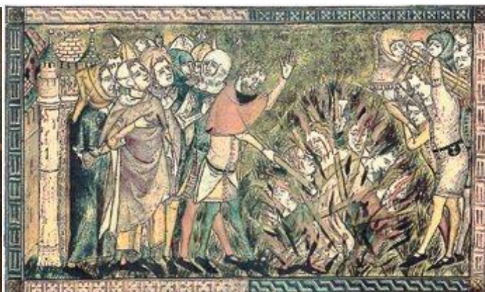
کشتار یهودیان استراسبورگ

بیست و پنجم بهمن در تاریخ فناوری و به ویژه فنون مربوط به رسانه‌ها هم روز مهمی بوده است. در چنین روزی به سال ۱۲۲۸ جیمز ناکس پولک اولین رئیس جمهور آمریکا شد که عکسش را گرفتند، در ۱۲۳۴ تگزاس با خط تلگراف به باقی شهرهای آمریکا وصل شد، در ۱۲۵۵ الکساندر گراهام بل و الیشا گری همزمان حق اختراع تلفن را ثبت کردند، و در ۱۲۹۷ اتحاد جماهیر شوروی گاهشمارى بر مبنای تقویم گریگوری را رسمی اعلام کرد. در ۱۳۰۳ هم شرکت «ثبت لوح پردازشگر» در آمریکا نامش را به «دستگاه‌های بین‌المللی کسب و کار» International Business Machines تغییر داد که همان IBM است. در ۱۳۸۴ هم تارنمای یوتیوب آغاز به کار کرد.