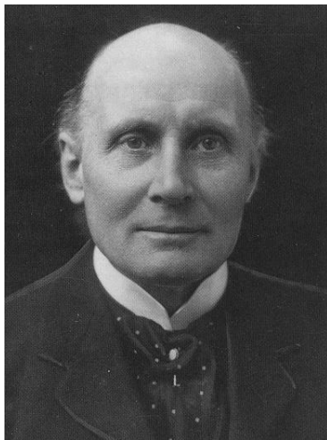
آلفرد نورث وایتهد

از میان مردم ایران زمین میرزا غالب دهلوی شاعر سبک هندی در چنین روزی به سال ۱۲۴۸ درگذشت. رفتگان نامدار دیگر این روز عبارتند از: گوته فرید افرایم لسینگ فیلسوف آلمانی (۱۱۶۰)، بازیل هال چمبرلین مورخ و فیلسوف نژادپرست انگلیسی (۱۳۱۴)، و ریچارد فاینمن فیزیکدان آمریکایی (۱۳۶۷). مهمترین زادگان این روز هم عبارتند از گالیئو گالیله (۹۴۳)، لویی پانزدهم شاه فرانسه (۱۰۸۹)، آلفرد نورث وایتهد فیلسوف انگلیسی (۱۲۴۰)، و داگلاس هوفشتادلر دانشمند آمریکایی (۱۳۲۴).