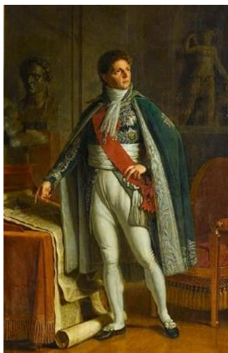
لویی الکساندر برتیه