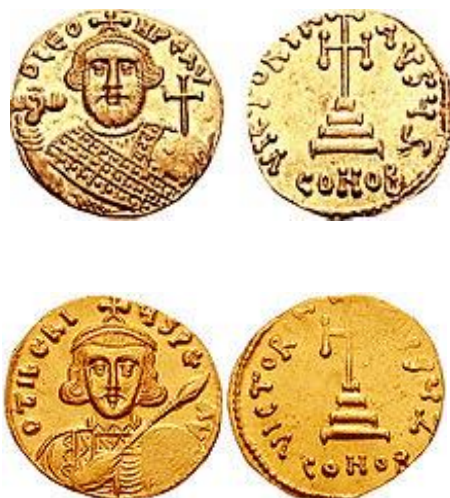
سکه‌های لئونتیوس (بالا) و تیریوس (پایین)

در چنین روزی به سال ۸۵ هجری خورشیدی به فرمان یوستینیان دوم امپراتور روم شرقی، تیریوس سوم و لئونتیوس که پیشتر امپراتور بودند را در کلیسای کنستانتینوپل اعدام کردند. در سال ۴۹۲ پاپ پاسکال دوم طی فرمانی تاسیس فرقه‌ی شهبوران مهمان‌نواز (هوپیتال‌ها) را اعلام کرد و ایشان را تقدیس کرد، و در ۱۰۱۶ فردیناند سوم امپراتور مقدس روم شد. در ۱۱۷۷ هم لویی الکساندر برتیه سردار ناپلئون که پنج روز پیشتر رم را فتح کرده بود در این شهر تاسیس جمهوری روم را اعلام کرد.