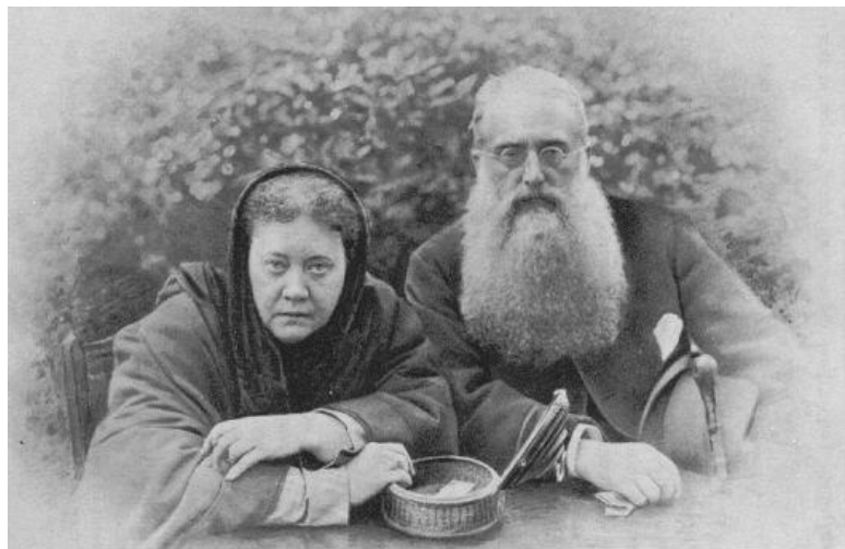
بلاواتسکی و آلکوت