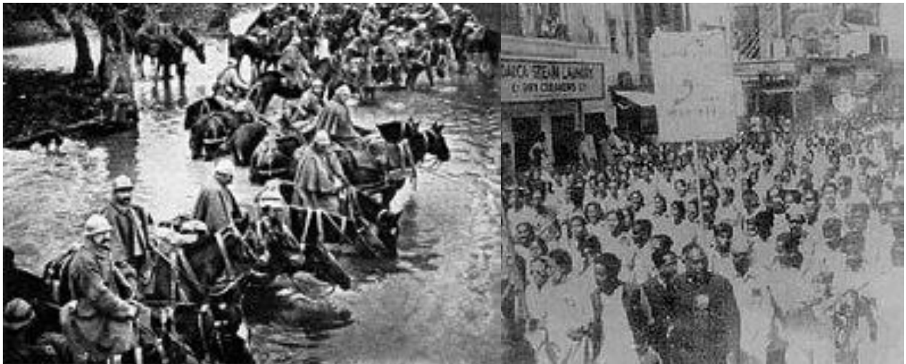
آغازگاه نبرد وردن