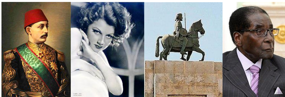
سلطان مراد پنجم

در میان مردم متعلق به حوزه‌ی تمدن ایرانی سلطان مراد پنجم عثمانی در این روز به سال ۱۲۱۹ زاده شد و شیرعلی خان افغان در ۱۲۵۷ و صادق طباطبایی دولتمرد و روزنامه‌نگار در ۱۳۹۴ درگذشتند.