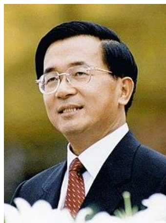
چن شوئی بیان

بیست و نهم اسفند زادروز گویوک خان ایلخان مغول (۵۸۵)، شیخ عبدالغنی بن اسماعیل نابلوسی صوفی دمشقی (۱۰۲۰) و تولد سید اسماعیل نواب صفا (۱۳۰۳) است و در همین روز به سال ۱۳۰۳ نریمان نریمانوف سیاستمدار بلشویک آرانی (آذری) که گناه خونهای بسیار بر گردنش مانده درگذشت. سید محمد علی ریاضی یزدی شاعر مذهبی معاصر هم در همین روز به سال ۱۳۶۳ درگذشته است. در همین روز به سال ۱۲۸۵ آدولف آیشمن فرماندهی نازی زاده شد و در ۲۳۵ میلادی الکساندر سوروس امپراتور روم درگذشت. در ۳۳۲ هجری خورشیدی هم المنصور بالله خلیفه‌ی فاطمی فوت کرد.