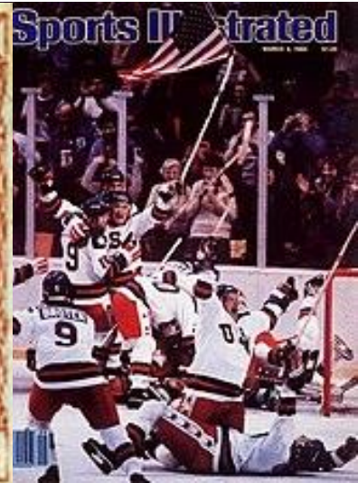
بازی هاکی آمریکا و فنلاند

از رخدادهای فرهنگی و اجتماعی واقع شده در پنجم اسفند هم می توان به این موارد اشاره کرد: در سال ۹۸۶ «اورفه» (L'Orfeo) اثر مونته وردی که یکی از اولین نمایشهای اپرایی بود بر صحنه رفت، در ۱۰۹۰ اپرای رینالدو اثر گئورگ فریدریش هاندل اولین اپرای سبک ایتالیایی شد که در لندن بر صحنه رفت، و در ۱۲۳۳ پنی سرخ اولین تمبر پستی بود که توزیع انبوه شد، در سال ۱۲۵۹ هم تیم هاکی روی یخ آمریکا پس از غلبه بر روسیه بر تیم مقتدر فنلاند هم غلبه کرد و مایه‌ی شگفتی تماشاچیان شد.