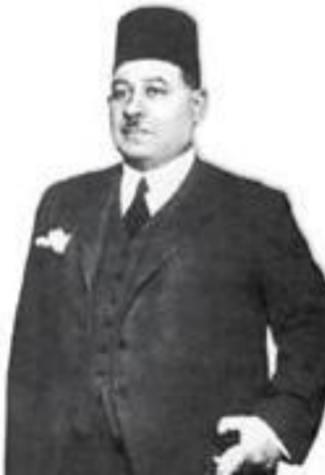
احمد ماهر پاشا