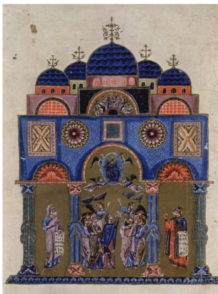
دفن استخوانهای نیکفوروس