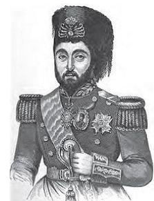
مصطفی رشید پاشا